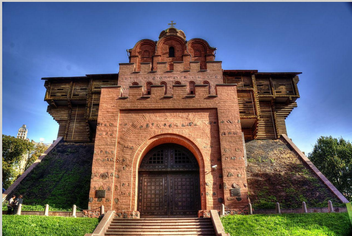
Золотые Ворота в Киеве. Главный вход в город XI века.

археологические раскопки подтверждают эти сведения. Однако до нас дошли постройки уже XI века — прежде всего это Золотые ворота в Киеве.