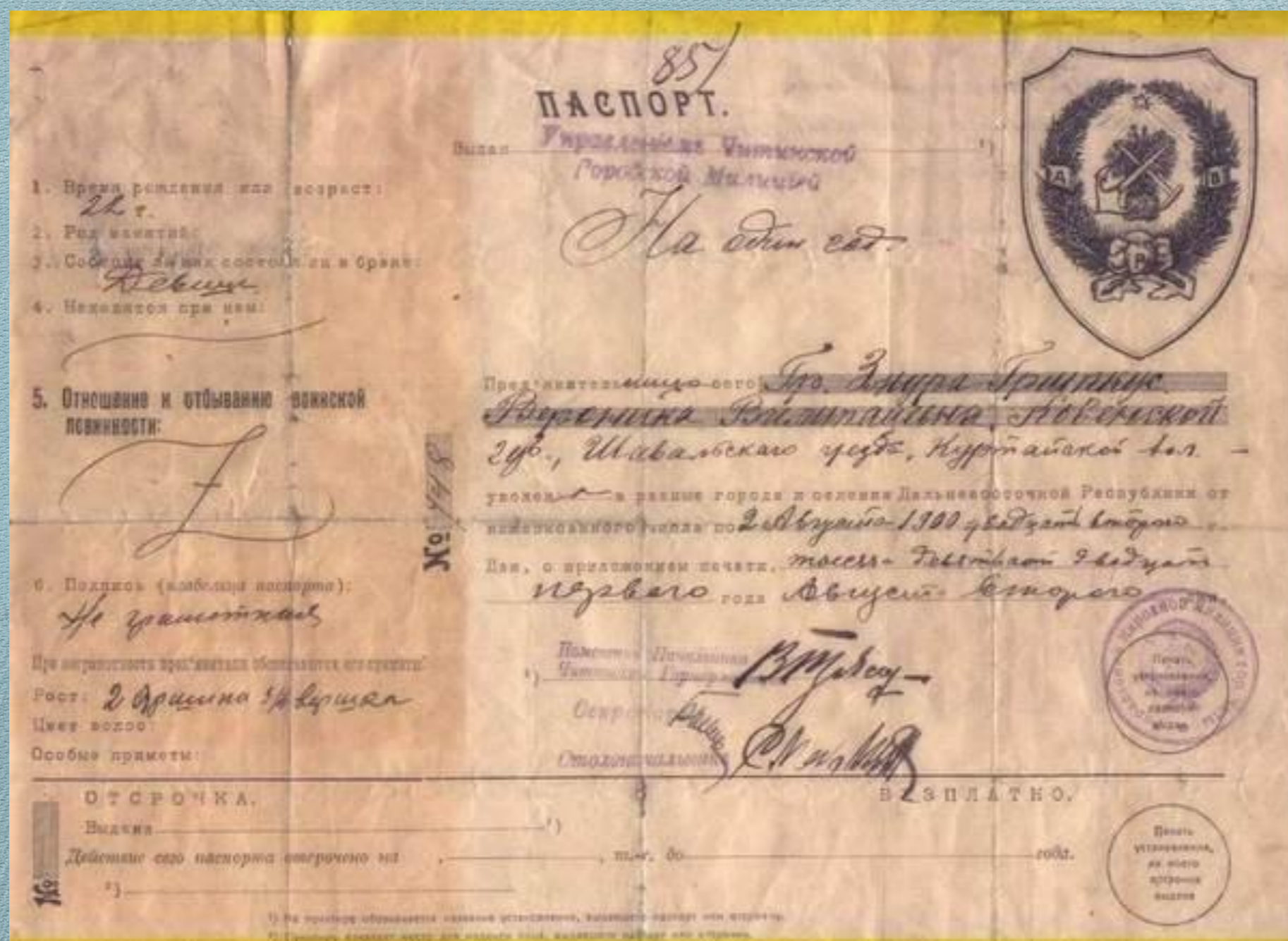
Российский паспорт, 1900 г.