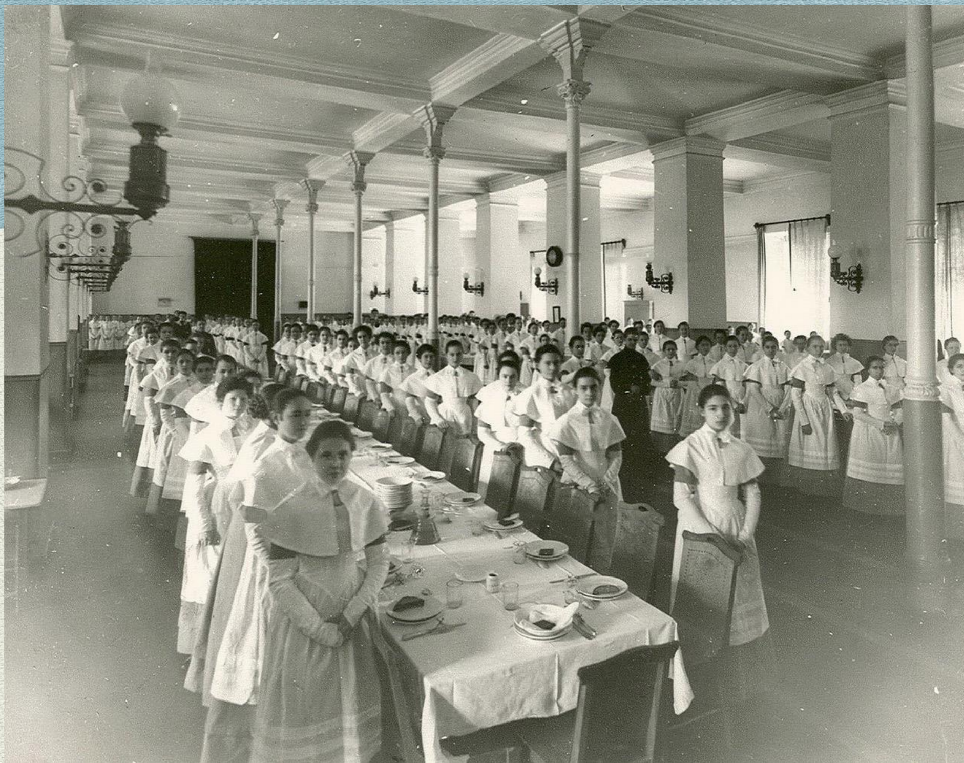
Воспитанницы Смольного в столовой перед обедом, 1913 г.