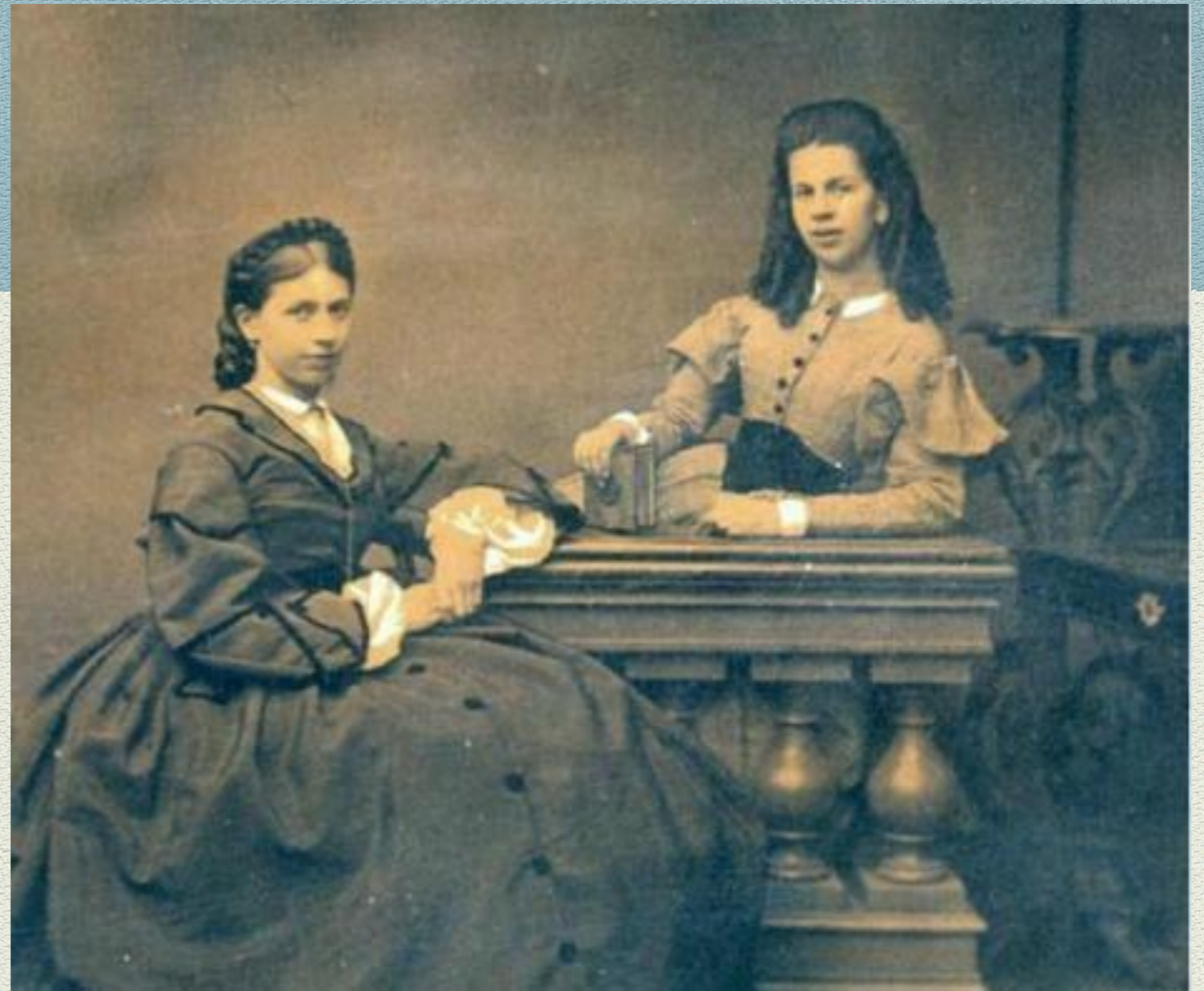
Сёстры Берс, Софья (будущая супруга Льва Николаевича Толстого, слева) и Татьяна, ок.1860 г.