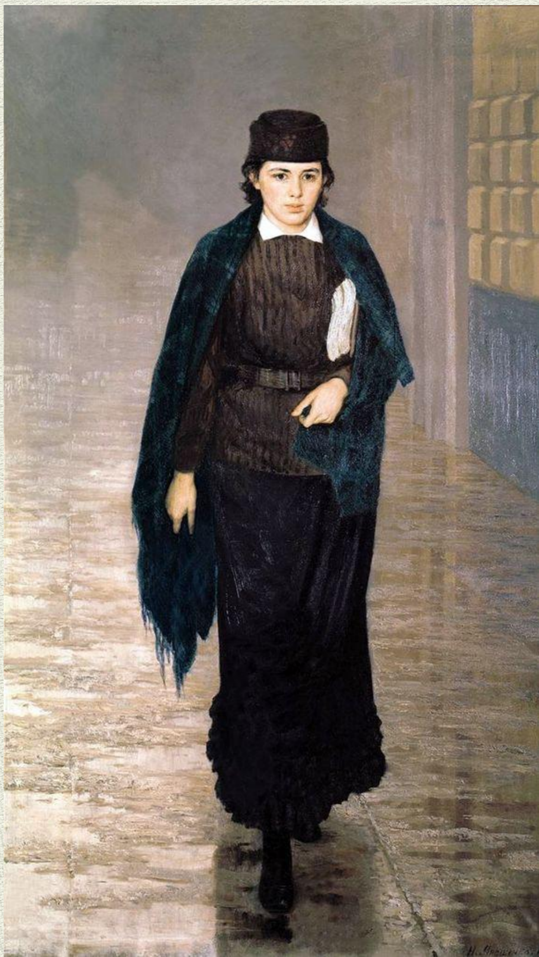
Н.А. Ярошенко, «Курсистка», 1883 год