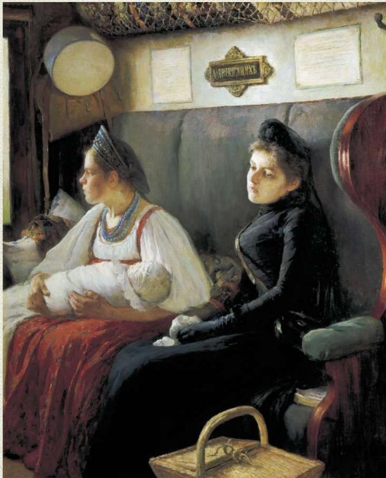
Л.О.Пастернак, «К родным», 1891 год