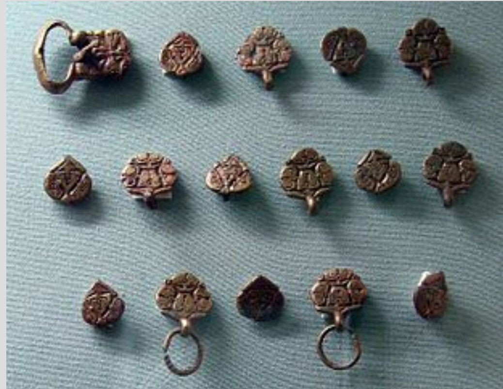
Детали мужского поясного набора, VIII—IX века