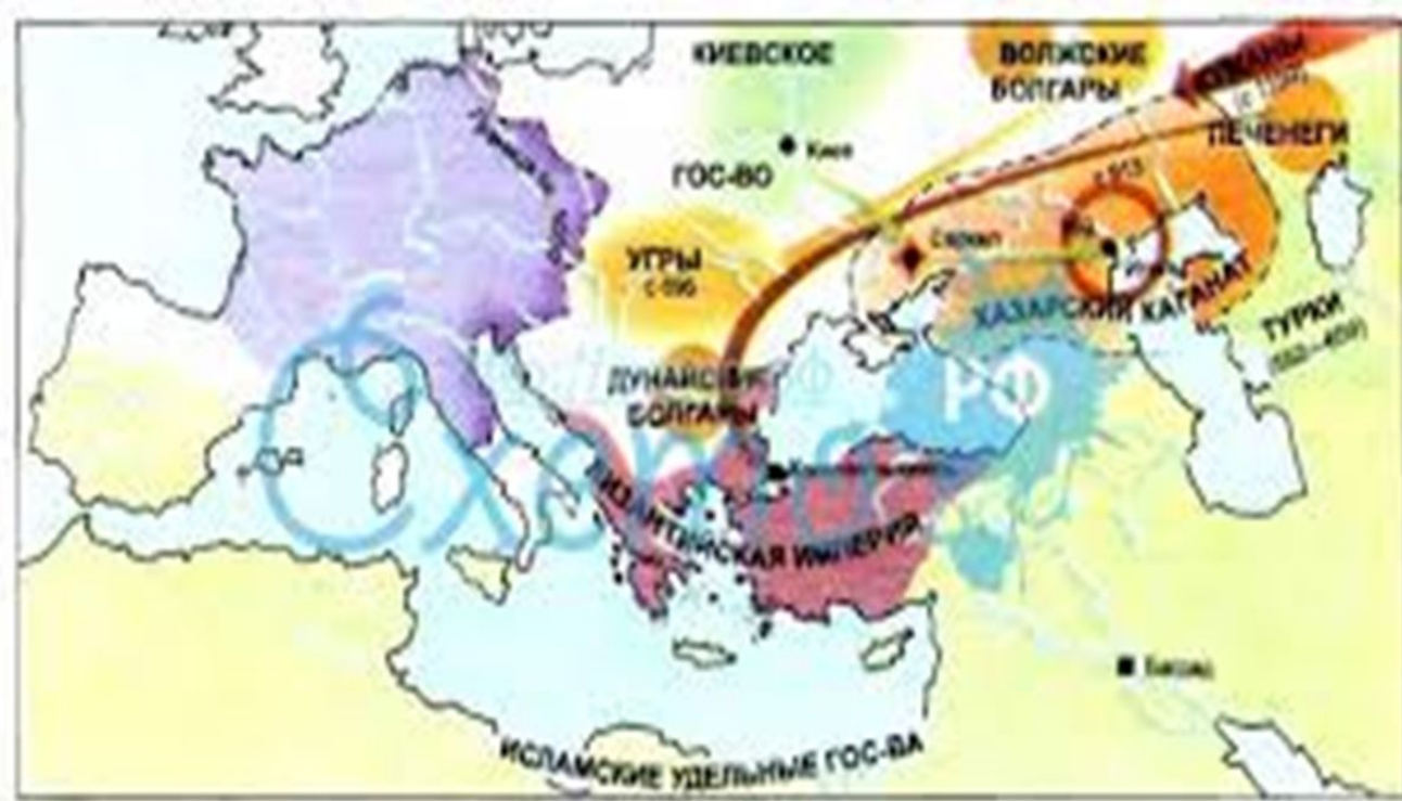
Хазары, печенеги, куманы и угры (мадьары)