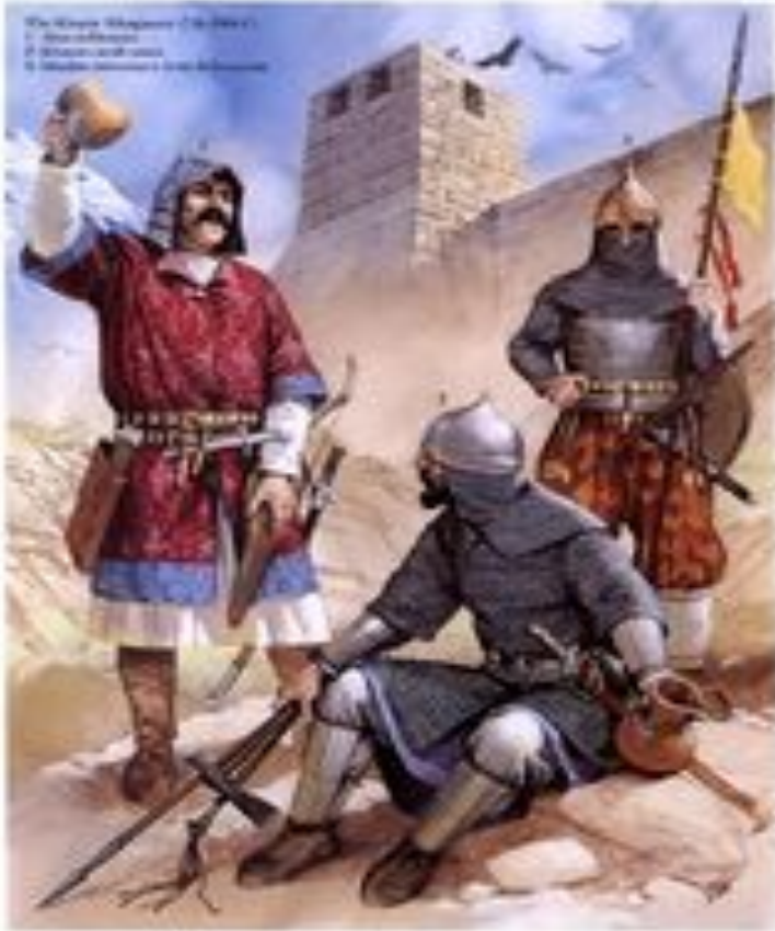
Настоящий хазарин и его соседи

Настоящий хазарин должен быть воинственен, прагматичен, циничен, лицемерен, скареден (недаром в идише хазарами называют жадных людей), иметь толстый кошелёк и кривые от постоянной верховой езды ноги. Сочетание прагматизма и скаредности приводило к удивительным парадоксам: так, несмотря на то, что хазары считались отличными воинами и служили в гвардии как у византийцев, так и у арабов, гвардию самих хазарских правителей составляли наёмники-аорсы, мусульмане хорезмийского происхождения, которые не только просили недорого, но и не сильно вникали в местные разборки, поскольку сами были не тюрками, а скорее родней нынешних таджиков или осетин.