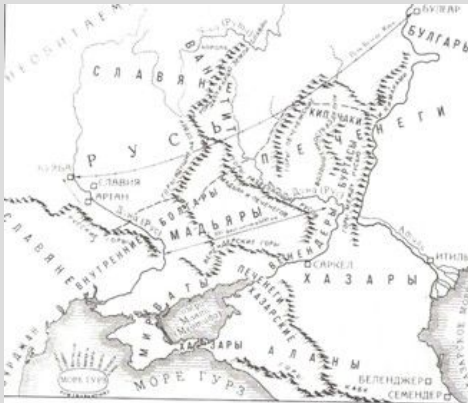
Племена Восточной Европы в первой половине IX в.

как государство Подонья и Приазовья, просуществовала с середины 7 века до 965 года. С приходом хазар племени, кочевавшие в донских степях, начинают вести оседлый образ жизни. Основными занятиями постепенно становятся земледелие и ремесленное производство. Значительное место в хозяйственной жизни занимало виноградоводство. В 834 году на берегу Дона была построена крепость Саркел. В 8 веке разные племена, населявшие донские степи, - аланы, болгары, угры, славяне, хазары, остатки готов, постоянно общаясь друг с другом, создали единую в основных своих чертах культуру.