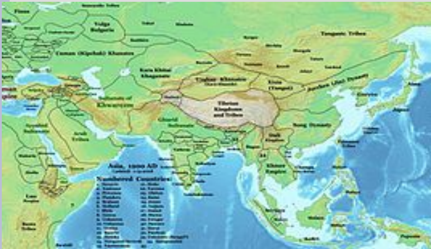
Карта Азии в XII веке, показывает половецкие земли и их соседей

Половцы - тюркская племенная группа, господствовавшая в южнорусских степях с половины 11 в. вплоть до нашествия монголов в 39-40-х гг. 13 в. Русские называли их половцами, иногда и византийским именем - куманы. Тюркское их имя "кипчак" является самоназванием и в русских летописях не упоминается. Во время господства половцев в южнорусских степях эта территория носила название Дешт-и Кыпчак, что по-русски передавалось как "поле Половецкое". В 12 в. "поле Половецкое" занимало огромное пространство. На западе половцкие кочевья доходили до Ингульца, а основная масса кочевников была сосредоточена на левом берегу Днепра и по берегам Сиваша. На востоке кочевья доходили до Волги, но большинство находилось на Донце и его притоках. Северная граница почти вплотную подходила к границе Руси, а южная шла по берегу Азовского моря.