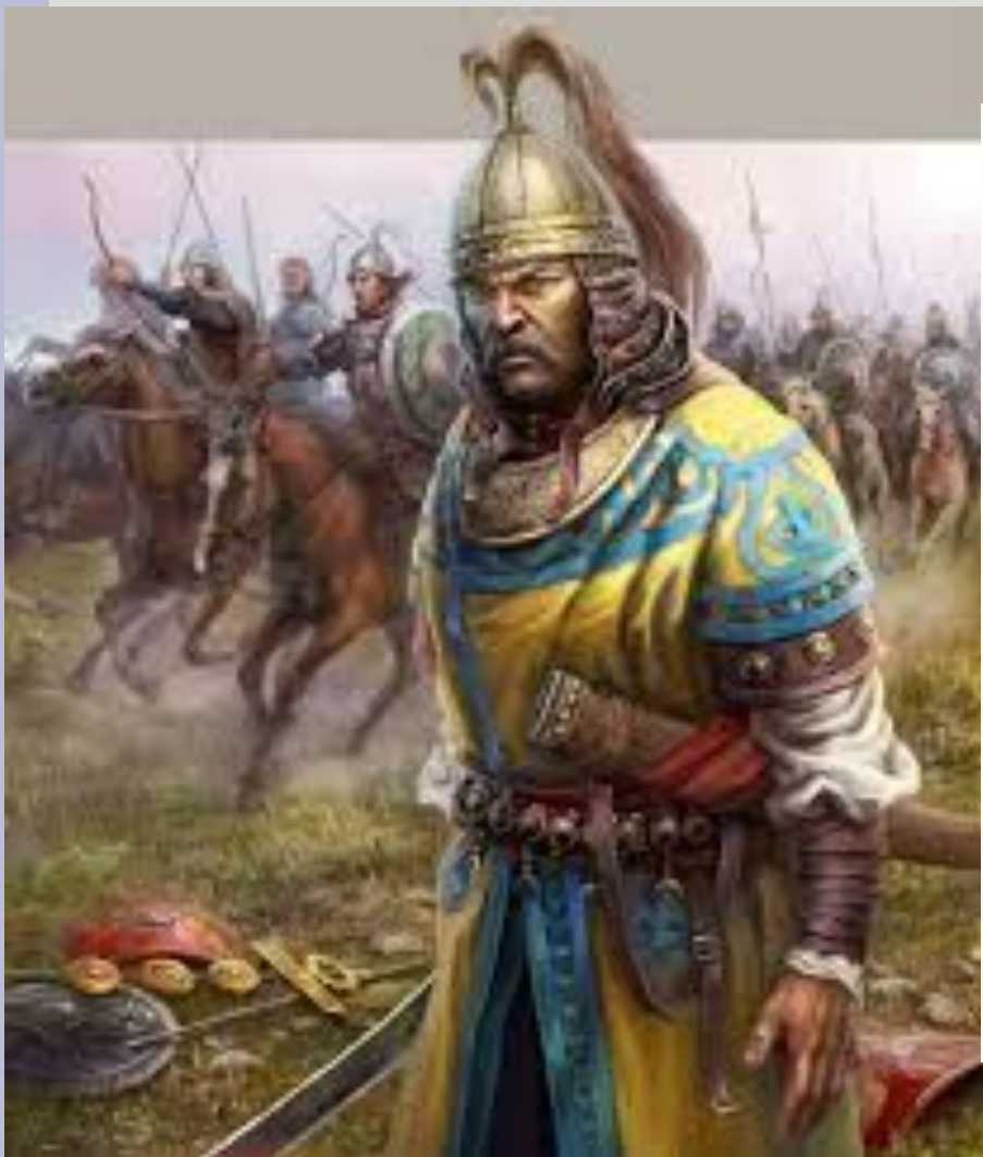
Половецкий хан со своими войсками (конец XII — начало XIII в.)

Половцы пришли на Дон с острогов Алтая и принесли с собой особый язык, верования и обычаи. Арабские географы отмечали религиозность, храбрость, подвижность, красоту фигуры, правильность черт лица и благородство половцев. Основным занятием половцев было кочевое скотоводство. Крупные становища со временем становились подобиями городов. Известны некоторые их названия: Шарукань, Сугров, Балин.