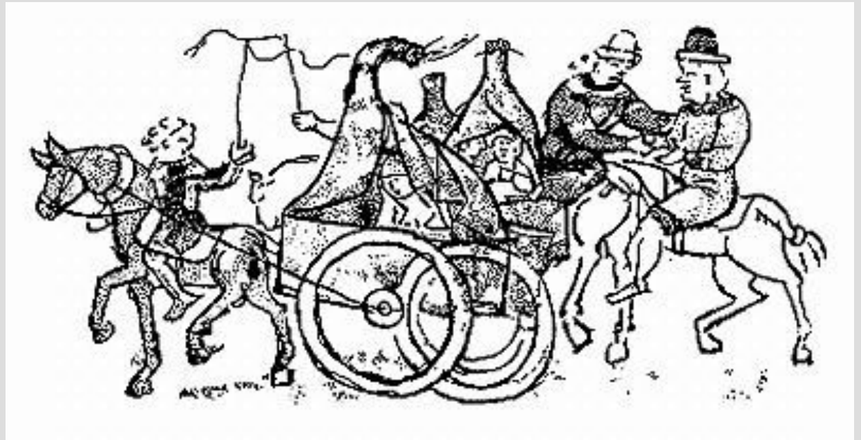
Половцы. Миниатюра из Радзивилловской летописи