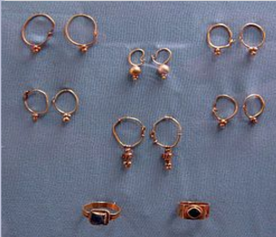
Женские украшения, VIII—IX века

После падения Хазарского каганата во второй половине X века хазары растворились в среде тюркоязычных кочевых народов, вошедших впоследствии в состав Золотой Орды. Какая-то часть этнических хазар, исповедовавших иудаизм, по всей вероятности, волилась в состав центральноевропейских еврейских общин. Потомками хазар считают себя некоторые представители тюркоязычных еврейских народностей — караимов и крымчаков, а также ираноязычные горские евреи. Хазарские корни, возможно, имеют некоторые тюркоговорящие народы Северного Кавказа.