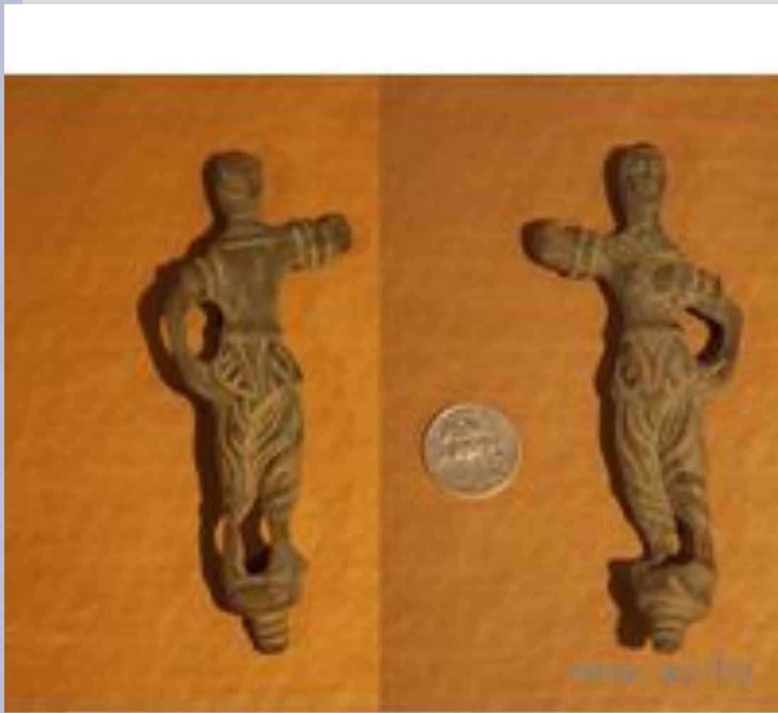
Полесские находки тюркского происхождения. Половцы, печенеги VIII - XIII века.

Печенеги описываются как брюнеты, которые брили свои бороды, имели невысокий рост, узкие лица, маленькие глаза. В конце 11 века, под давлением половцев, они передвинулись на Балканский полуостров или в Венгрию. В соответствии с научной гипотезой одна часть печенегов составила основу народности гагаузы. Другая часть, влившись в объединение чёрных клобуков, стала служить киевским князьям и осела в Поросье (Правобережная Украина).