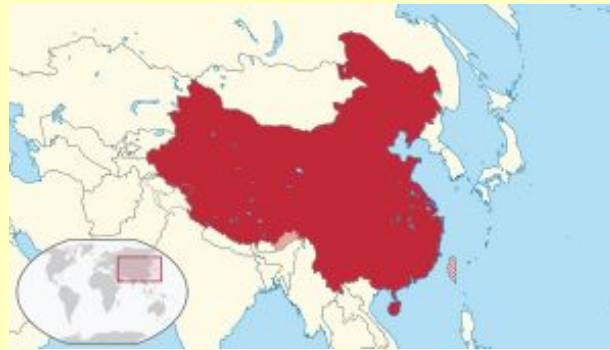
Әлем картасындағы орны