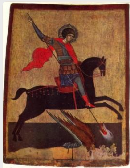
144. Кипи Звиропига. Икона в Стамбуле. Конец XIV в.