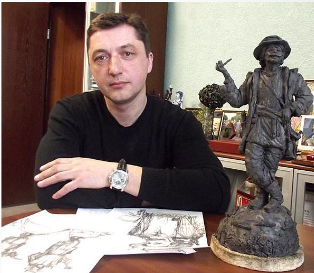
Аўтар помніка Сяргей Сотнікаў