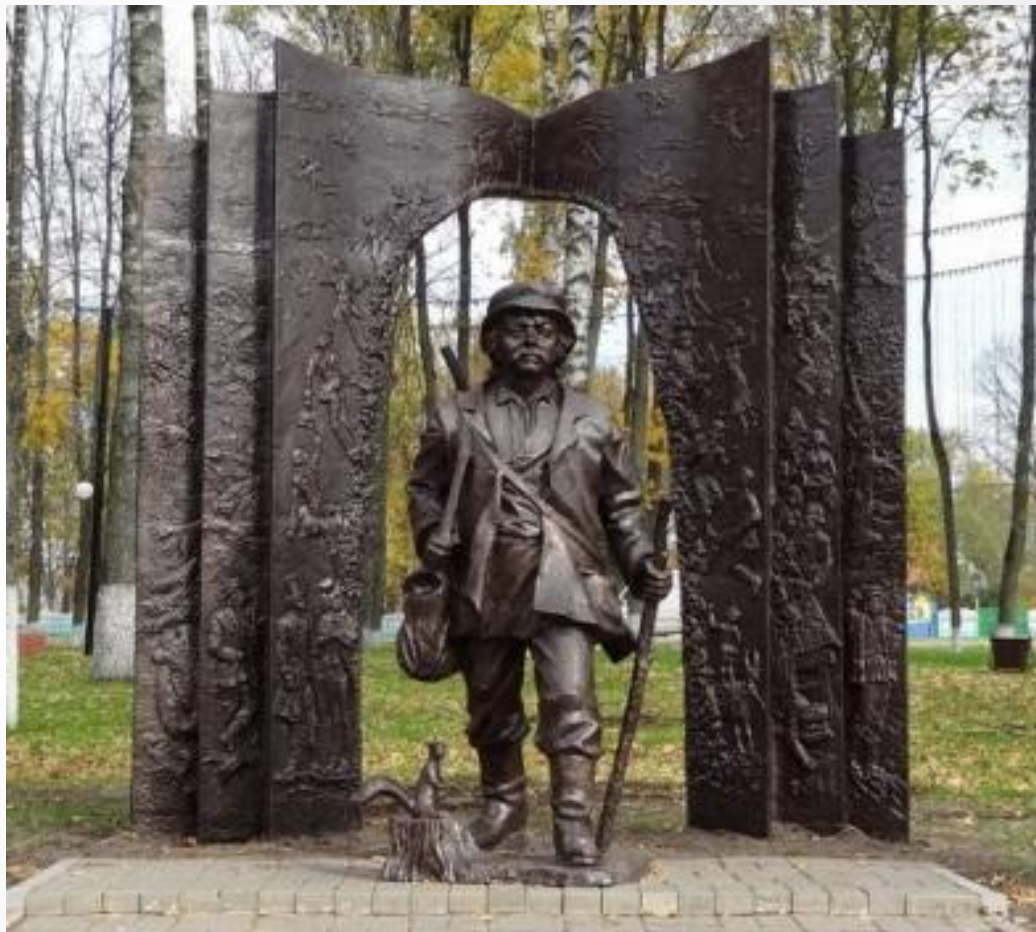
Выдатны помнік палясоўшчыку Тарасу