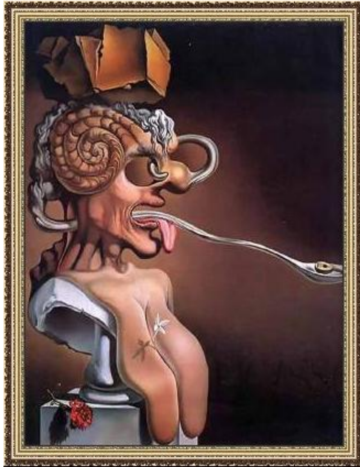
С. Дали. Портрет П. Пикассо

Б.Брехт – «Трехгрошовая опера». Надежда на новые социальные идеи.