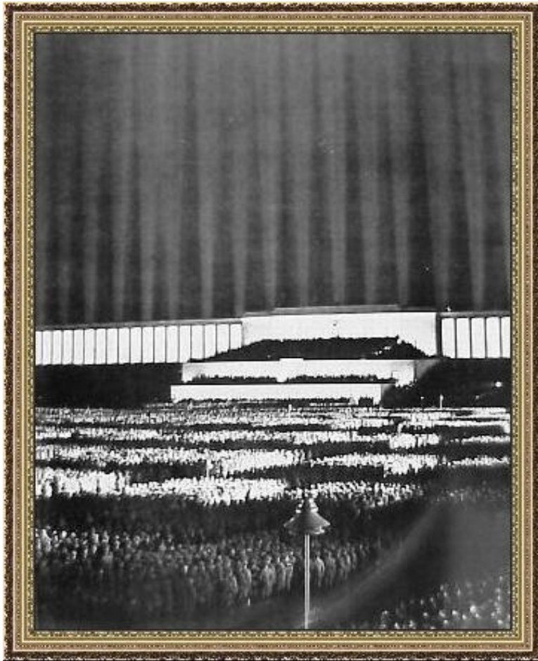
Нюрнберг. Партийный форум

1925 – Муссолини – фашизация нации, культура – инструмент. Контроль государства.