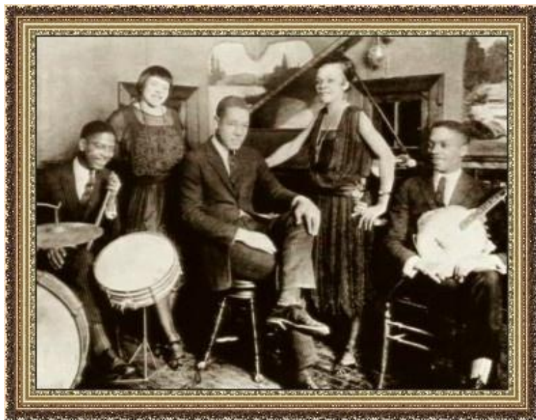
Негритянский джазовый оркестр

1927 – первый звуковой фильм. Документальный фильм. «Золотой век Голливуда» – производство на поток.