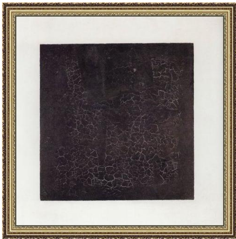
К. Малевич. Черный квадрат

Модерн – Создание прекрасного, привнесение его в жизнь. Синтез искусств (живопись, архитектура и т. д.), культур (западной, восточной), и стилей. Вычурность, элитарность.