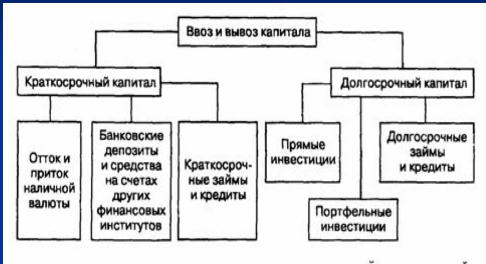
Рис. 1. Основные формы международного перемещения капитала