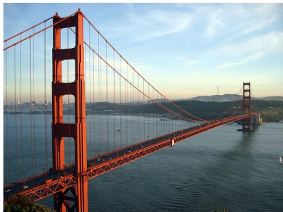
Golden Gate Bridge

Во большой степени — да , но основополагающие принципы везде одинаковые.