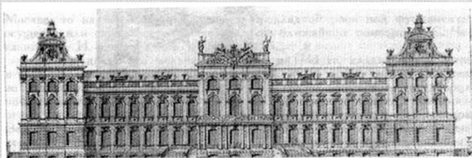
М. Г. Земцов. Фасад Аничкова дворца. Чертеж. Копия Г. Дмитриева.