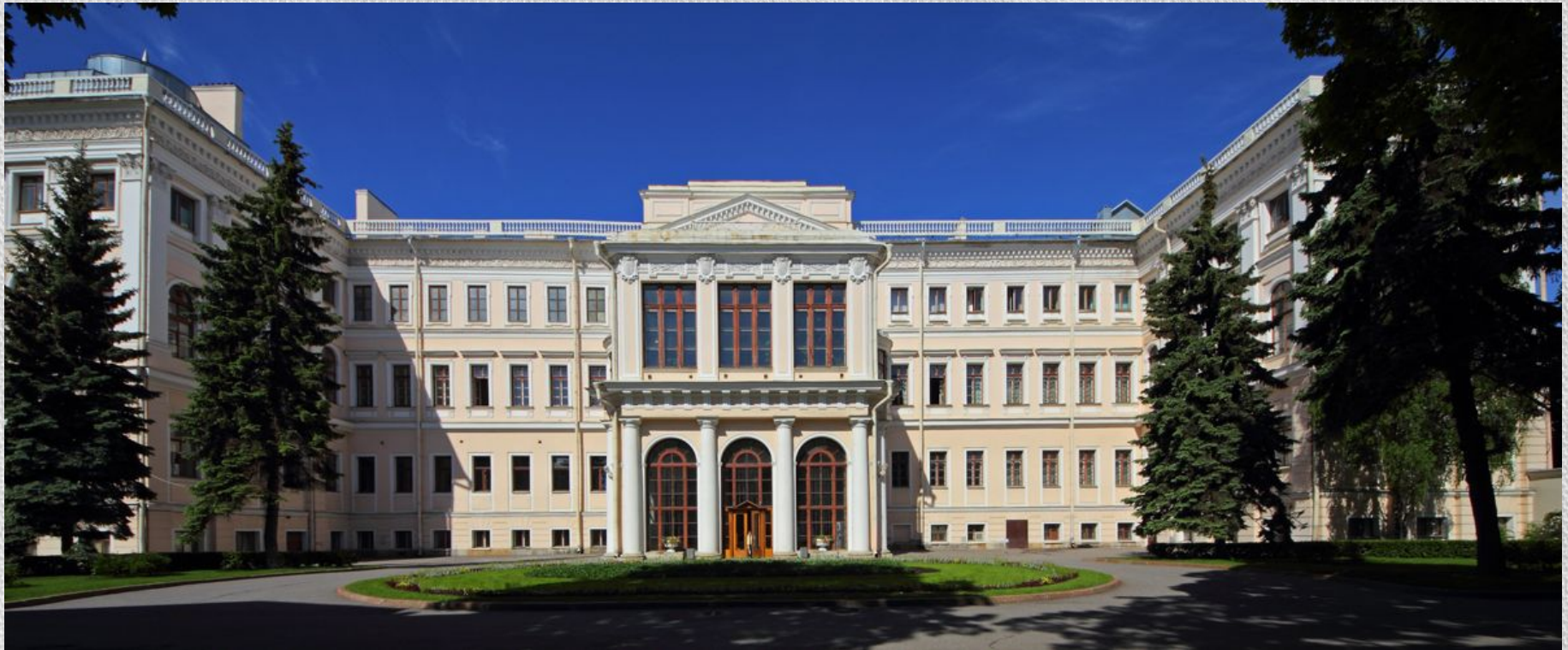
г. Санкт-Петербург, Аничков дворец (Невский пр., 39)

Знание всех методов консервации, свойств материалов, владение в художественном смысле слова историческими стилями и умение чувствовать художественный образ — все это необходимые предпосылки для успешного выполнения работы.