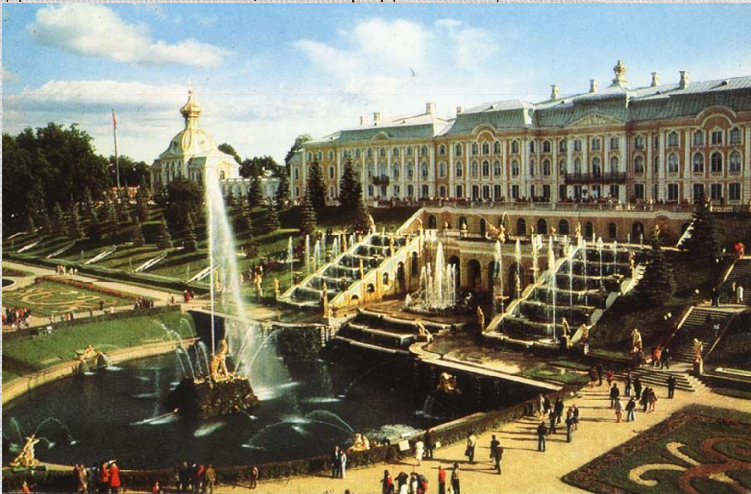
Ленинград, Петродворец (1976)