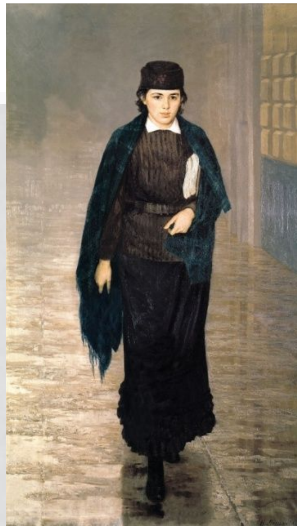
Маковський. Курсистка. (1883)