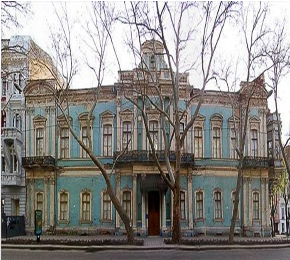
Музей імені Богдана і Варвари Ханенків.