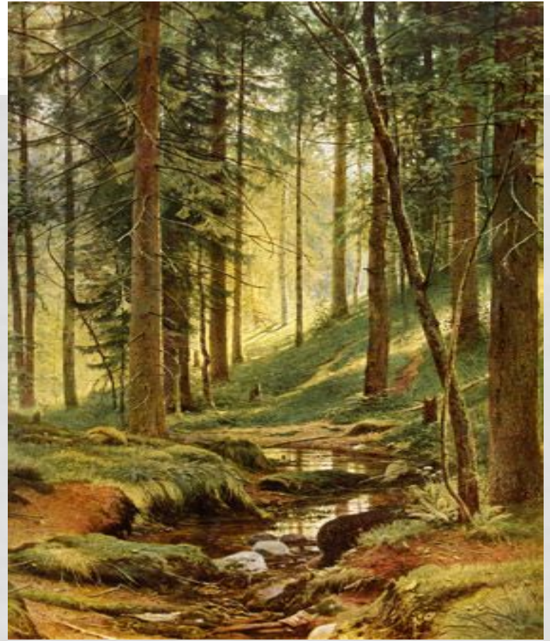
Струмок у лісі(1882), Шишикін