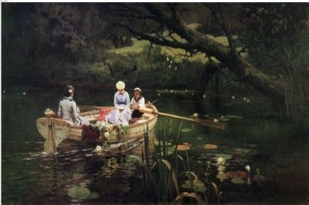
Поленов На човні. Абрамцево»(1885)