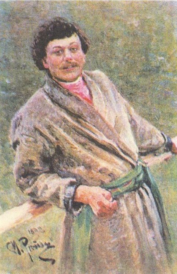
Белорус. Худож. И.Репин

Согласно переписи 1897 г. , на территории 5 западных губерний проживало 5 млн 408 тыс. белорусов, около 3,1 млн русских, поляков, украинцев, евреев, литовцев, латышей. Абсолютное большинство белорусов жили в сельской местности (более 90 %). Доля тех белорусов-горожан , которые говорили на родном языке, составляла около 14,5 %. Особенностью белорусов как этноса был раздел по конфессиональному признаку на православных и католиков . Православная церковь и католический костел не признавали существования белорусского этноса. В 1897 г. православные среди белорусов составляли 81,2 %