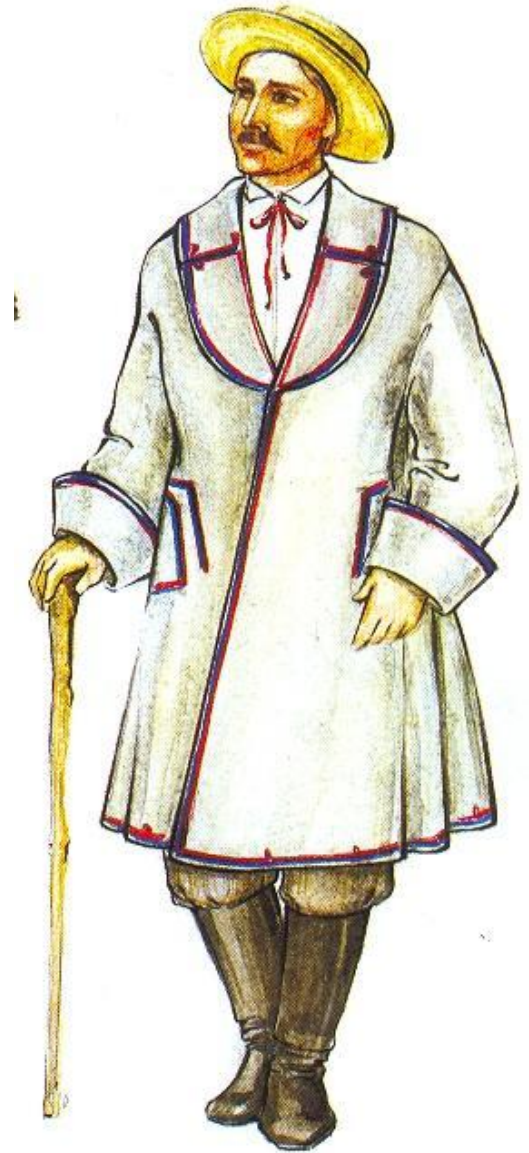
Мужчина в праздничной свитке

В связи со слабым развитием профессионального искусства главную сферу духовной культуры белорусской нации составляли народные формы искусства (фольклор, народное театральное искусство, музыка, танцы), традиционные обряды и обычаи. Своеобразие белорусского этноса отражалась в народном изобразительном и декоративно-прикладном искусстве. Традиционная (народная) культура концентрировалась в деревне. Белорусская нация формировалась как крестьянская в своей основе