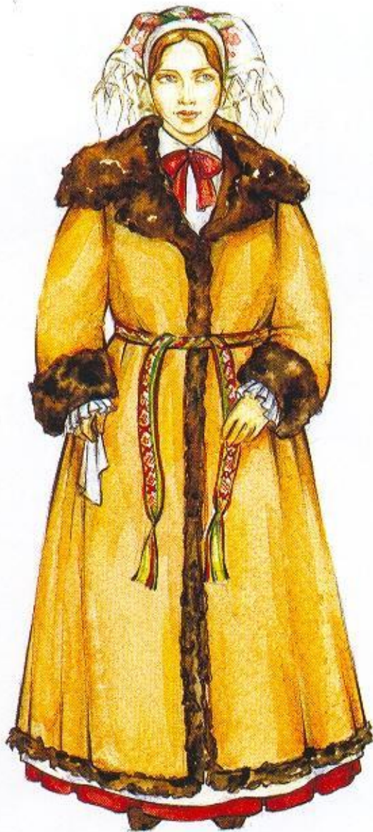
Женщина в зимней одежде

В первой половине XIX в. начал складываться новый белорусский литературный язык . Он не мог развиваться на базе старобелорусского языка, который с XVIII в. фактически стал мертвым. Белорусский литературный язык развивался главным образом как язык художественной литературы и частично публицистики. Существенным препятствием для его развития было отсутствие нормативной грамматики . Среднебелорусские говоры составили основу белорусского литературного языка. В целом процесс его формирования к концу XIX в. не завершился