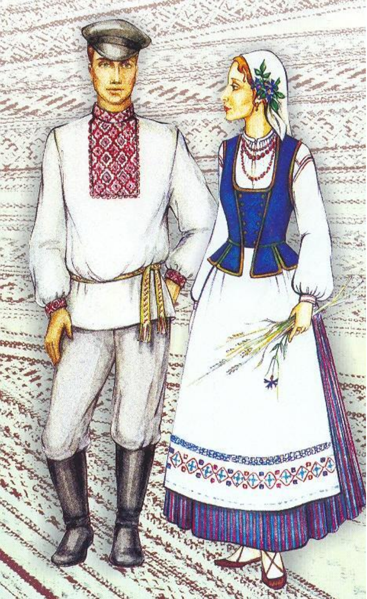
Пара в новогрудском уборе

Нация (от лат. patio – племя, народ) – историческое сообщество людей, которое характеризуется устойчивыми экономически-ми и территориальными связями, общностью языка, культуры, характера, быта, традиций, обычаев, самосознания. Нации возникают в период становления капиталистического способа производства