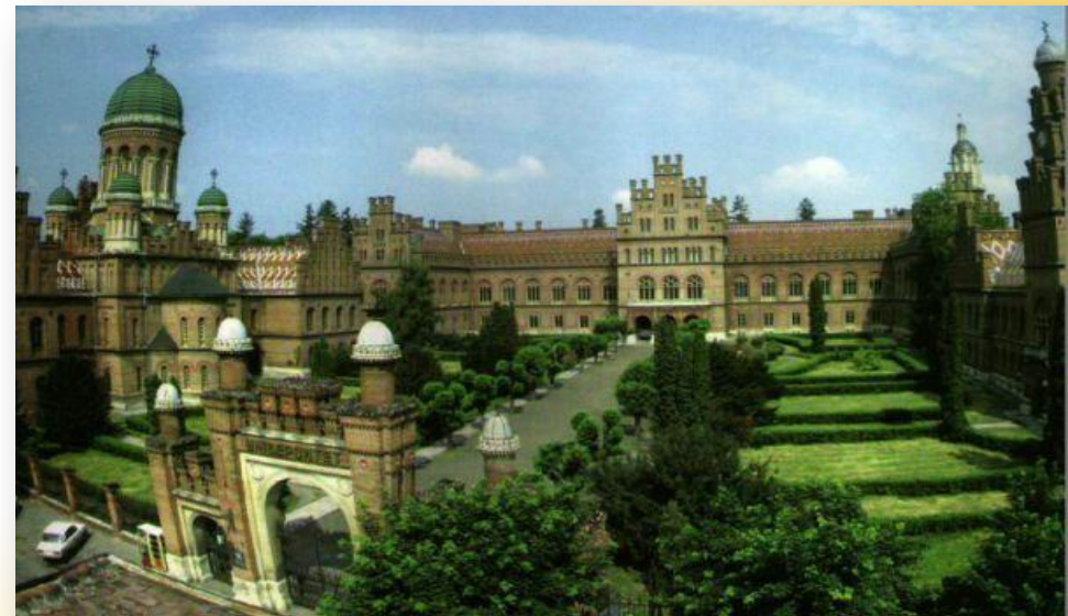
Резиденція Буковинських митрополитів