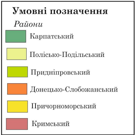
Рекреаційно-туристичне районування України (за М. Поколюдною 2001 р.)