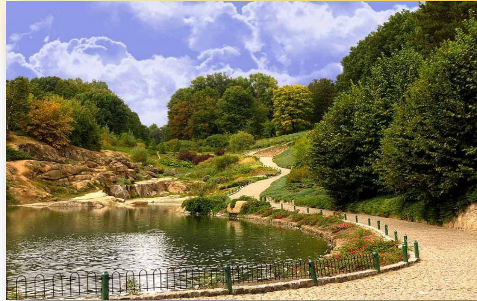
Національний дендропарк «Софіївка»