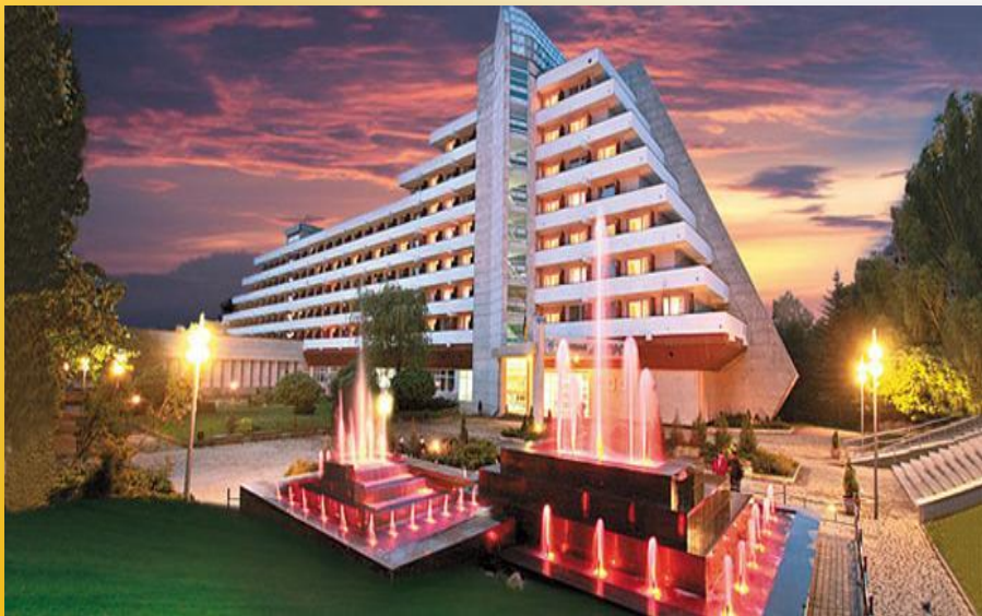
Санаторний комплекс «Дніпро-Бескид»