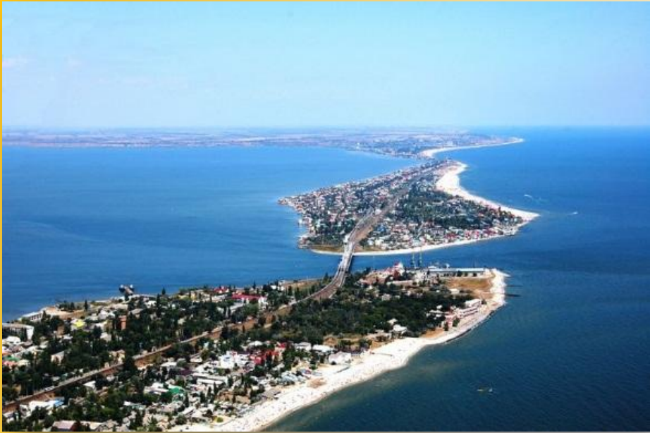
Курорт «Затока» м. Одеса