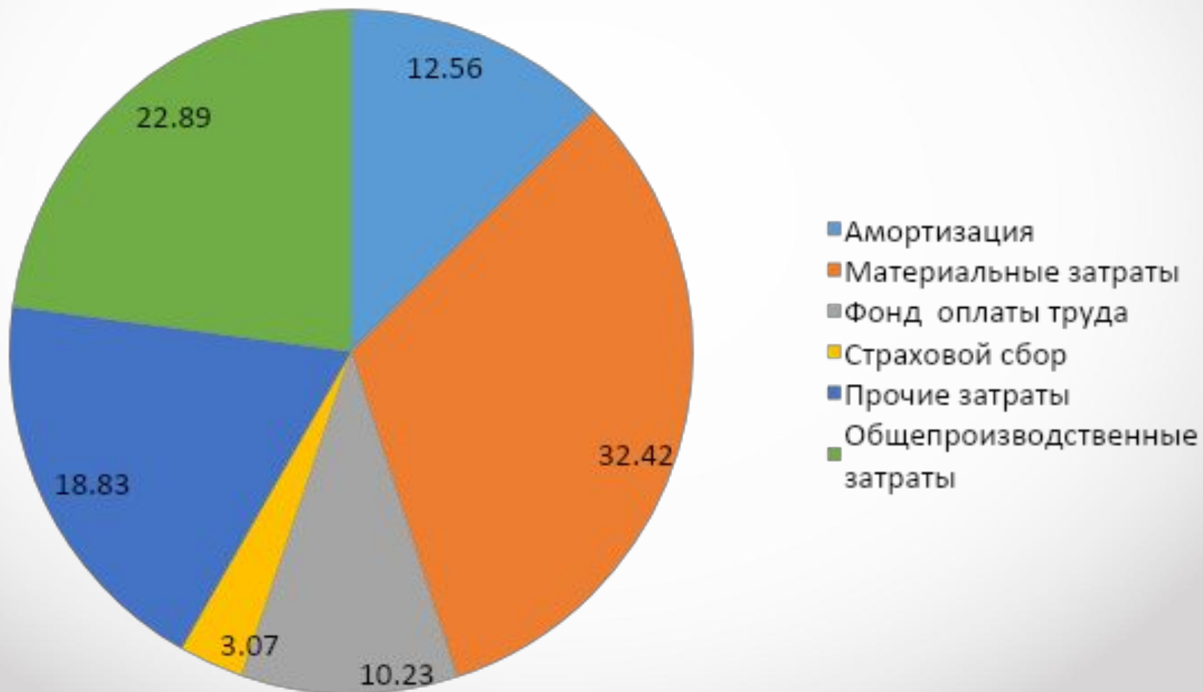
ДИАГРАММА СТРУКТУРЫ СЕБЕСТОИМОСТИ