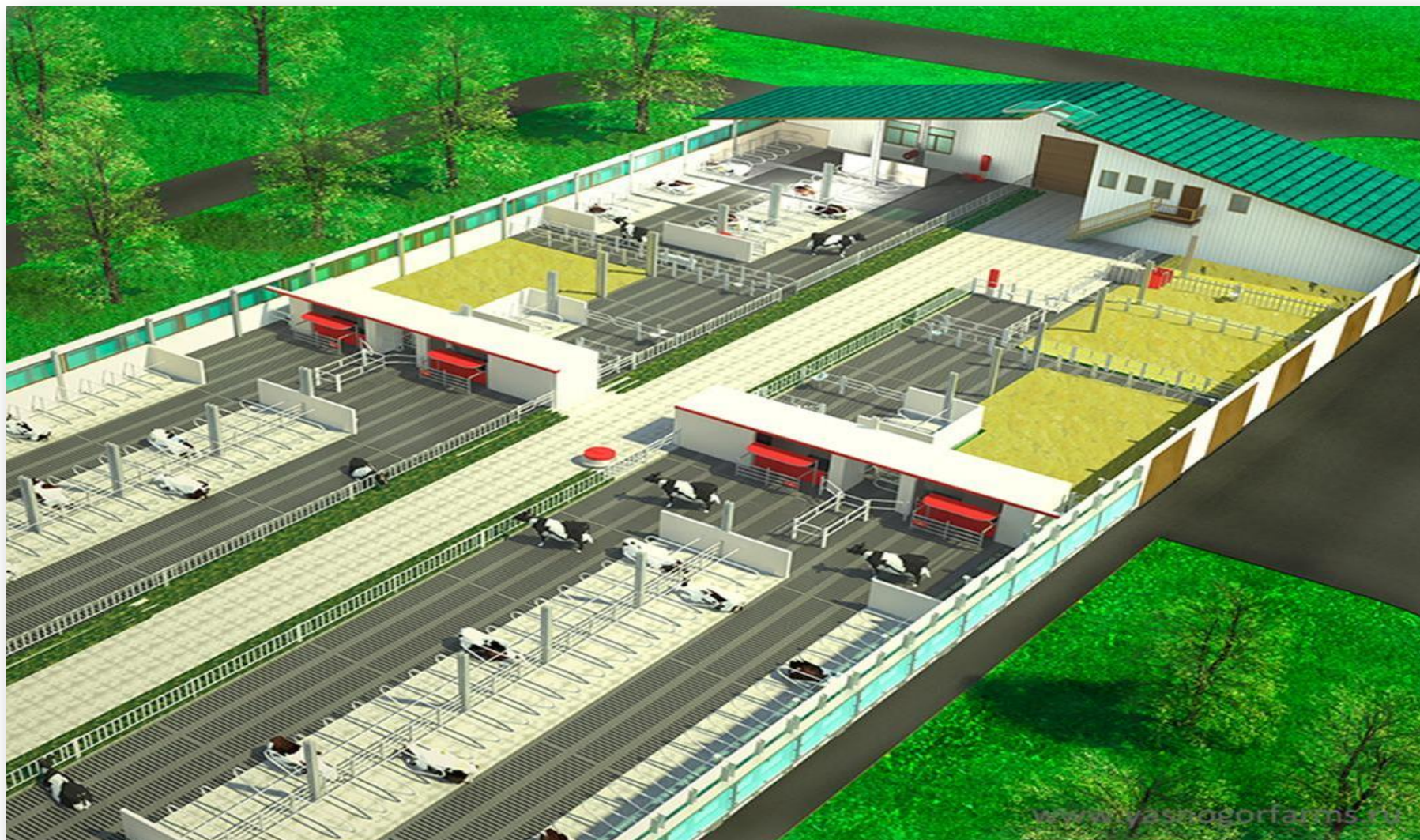
Рисунок 2. Схема корпуса содержания основного стада 3D