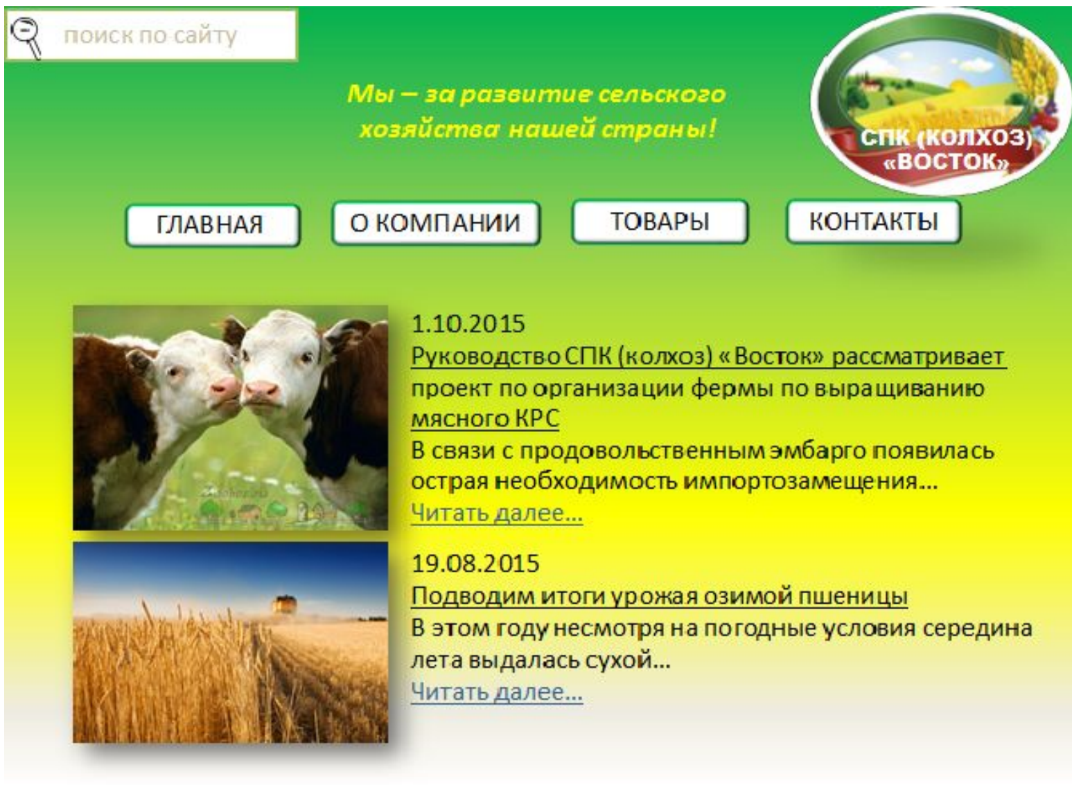
Рисунок 6. Макет сайта СПК (колхоз) «Восток»