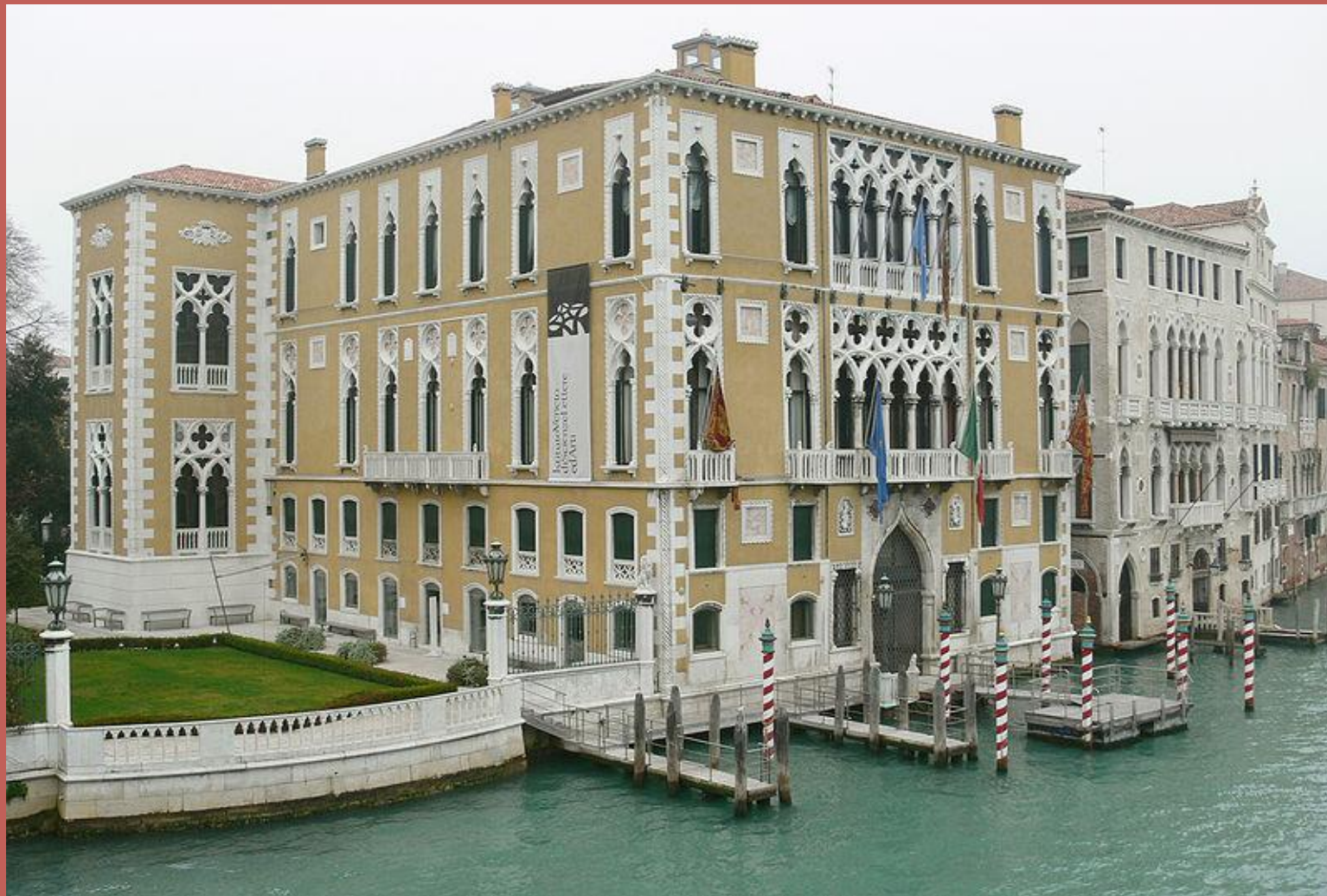
Палаццо Каваллі-Франкетті, Венеція