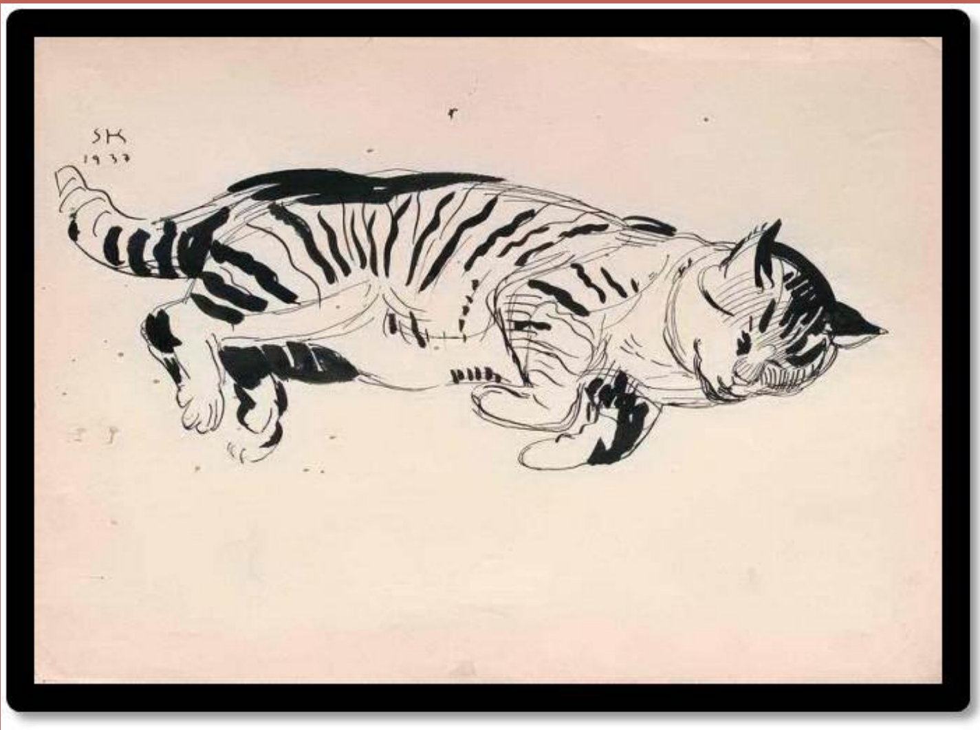
Сергій Конончук. «Кіт», 1937, Туш, перо