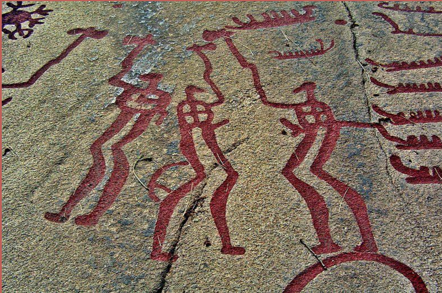
Ритуальний танок. Наскельний малюнок епохи бронзи, Швеція