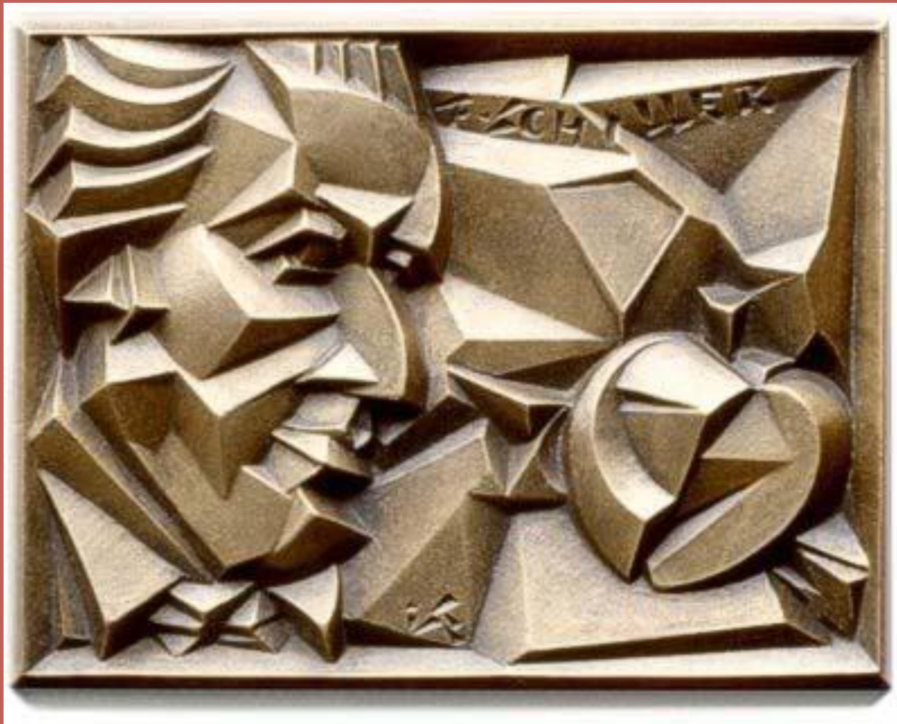
Рельєф «Фрідріх Шиллер», 1991