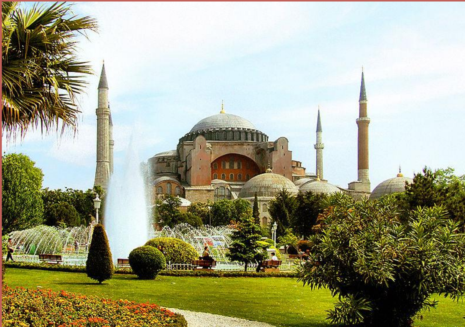
Собор Святої Софії, Константинополь