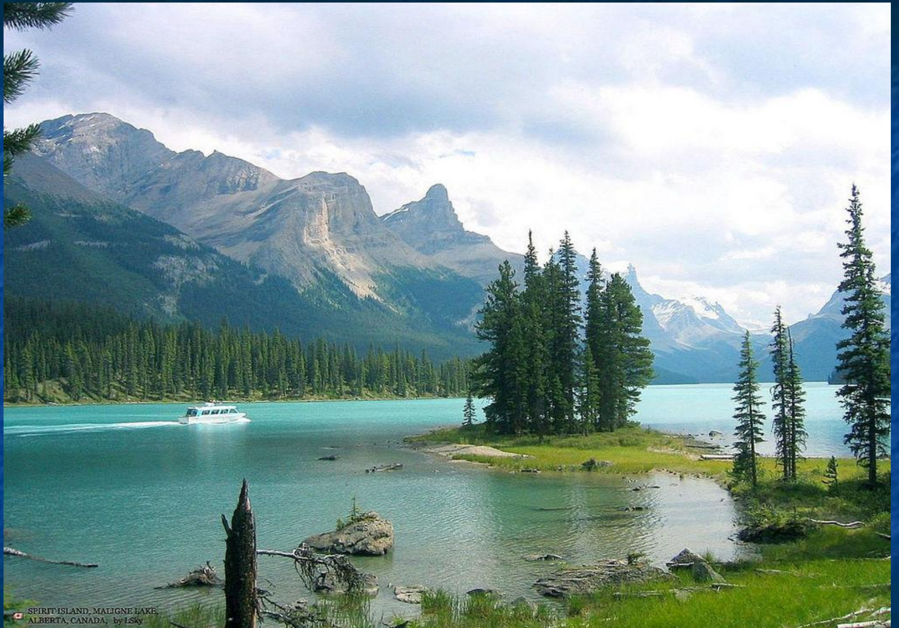
🇨🇦 SPIRIT ISLAND, MALIGNE LAKE, ALBERTA, CANADA