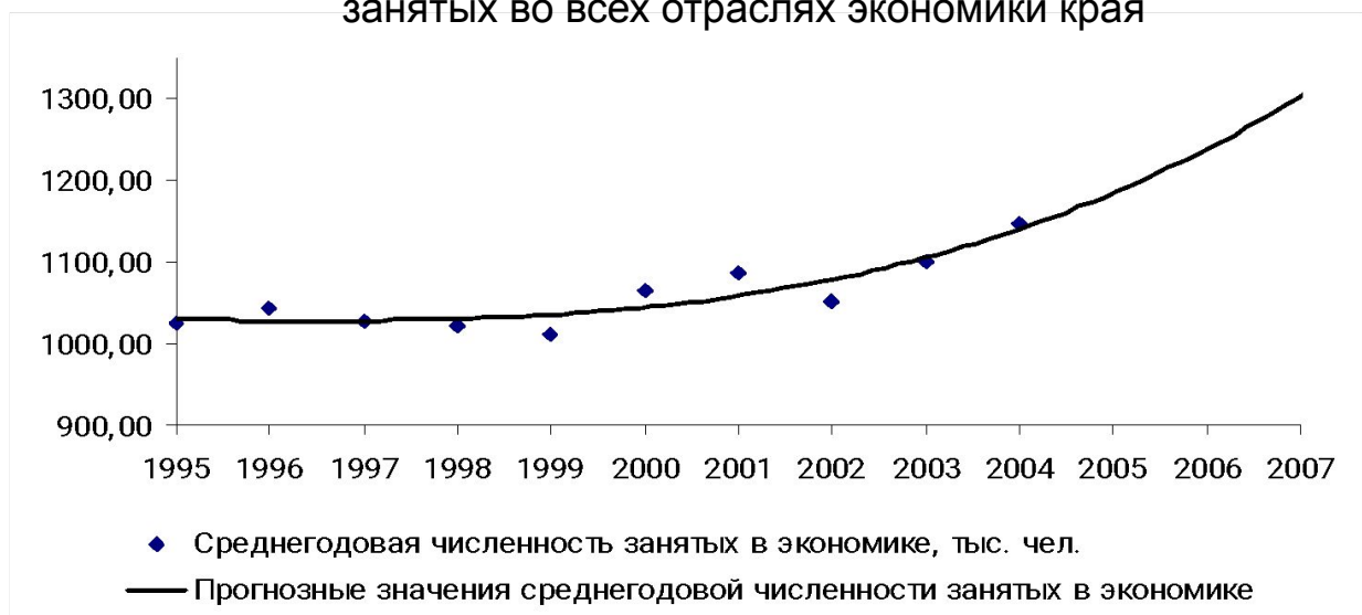
Рисунок 8 – Фактические и прогнозные значения среднегодовой численности занятых в экономике края