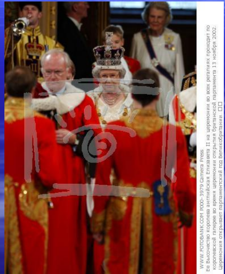
Ее Высочество королева английская Елизавета II на церемонии во всех регалиях проходит по королевской галерее во время церемонии открытия британской парламента 13 ноября 2002. Церемония открывает парламентарий год Великобритании. ПП

Королева Елизавета II произносит речь на открытии английского парламента, Вестминстер, Лондон, Великобритания, 13 ноября 2002.