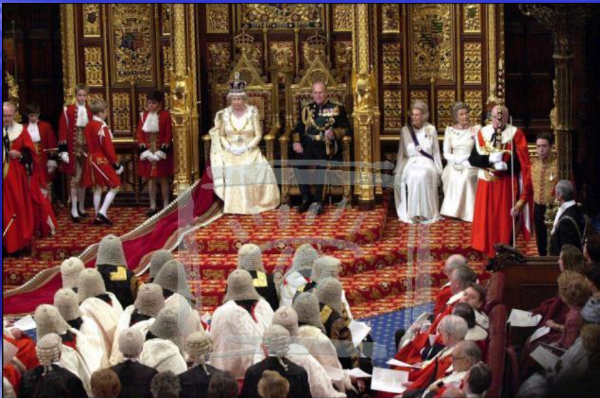
No:462053.01 Date:14.11.2002 Headline:LONDON : THE STATE OPENING OF PARLIAMENT... Caption: THE QUEEN SPEECH AT THE STATE OPENING OF PARLIAMENT...