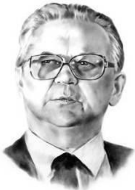
Олесь Гончар (1918—1985)