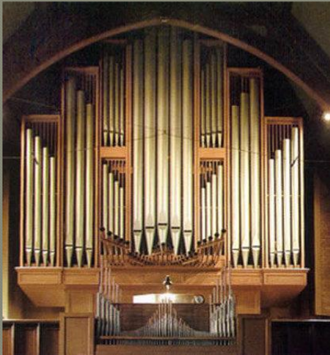
орган может воспроизводить инфразвук

Инфразвук – это механические колебания упругой среды, имеющие одинаковую со звуком физическую природу, но частоту ниже воспринимаемой человеческим ухом (ниже 20 Гц).