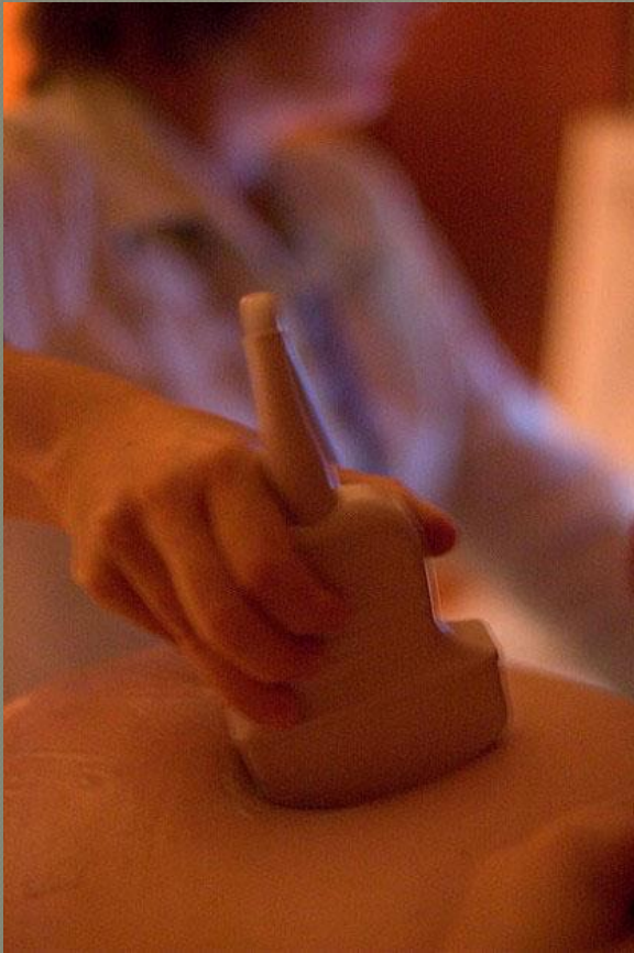
Применение ультразвука в исследовании пациента

Ультразвук – это механические колебания упругой среды, имеющие одинаковую со звуком физическую природу, но превышающие верхний порог слышимости – свыше 20 000Гц или 20 кГц.