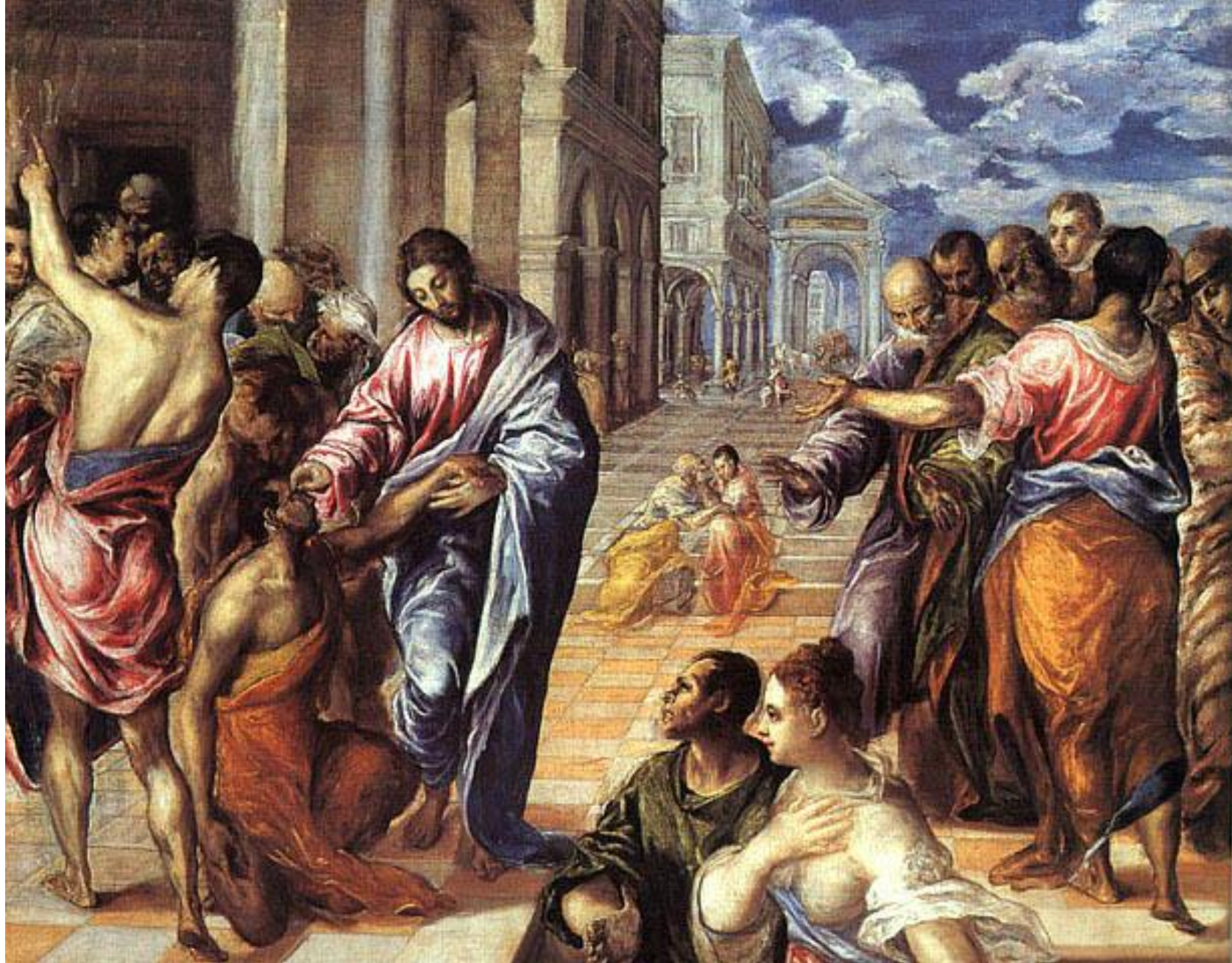
«Христос, исцеляющий слепого»