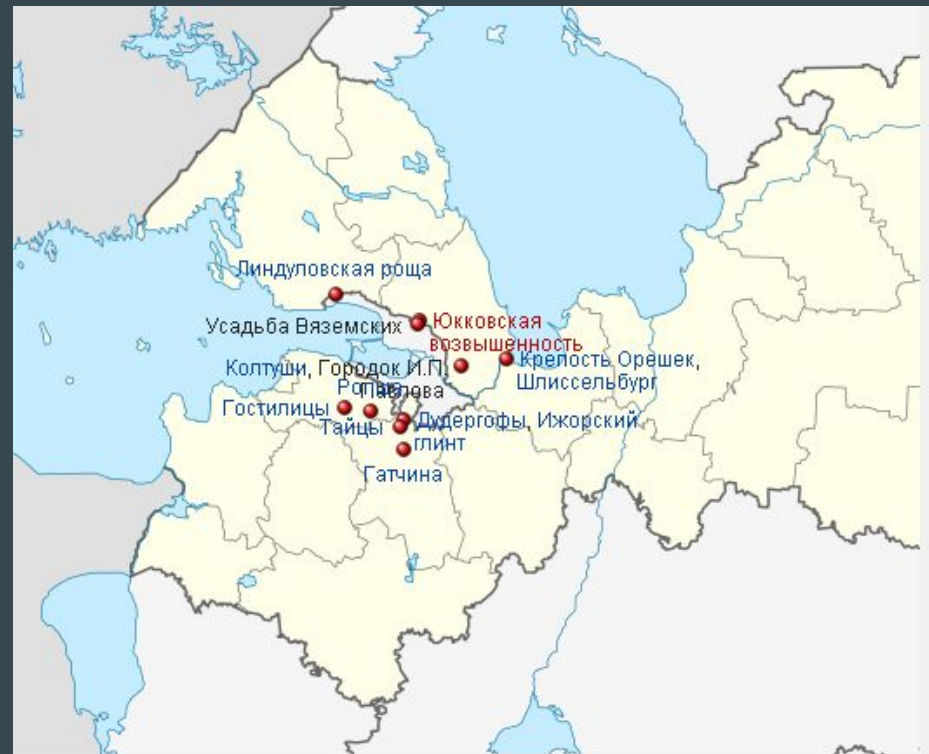
Памятники Ленинградской области