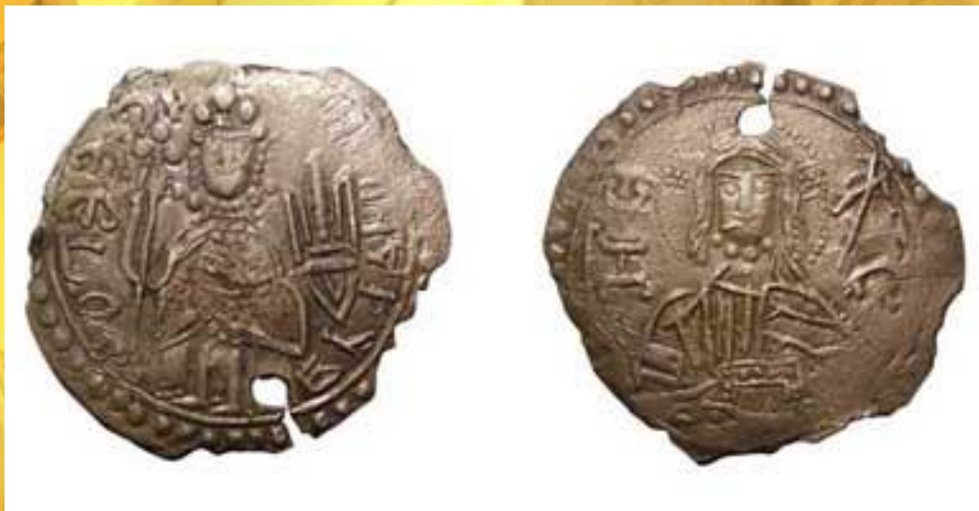
Монета Киевской Руси