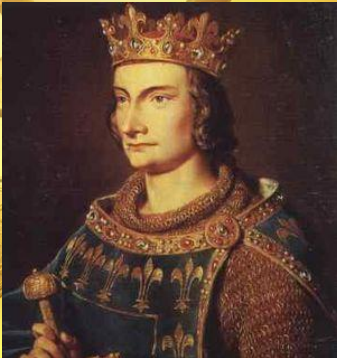
Филипп IV Красивый