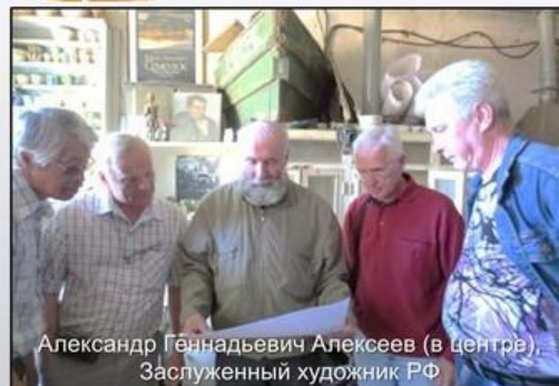
Александр Геннадьевич Алексеев (в центре), Заслуженный художник РФ