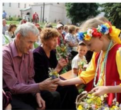
ПРАЗДНИК «МЕДОВЫЙ СПАС»