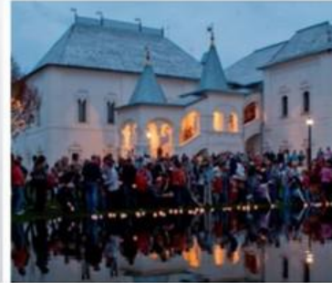
МЕЖДУНАРОДНАЯ АКЦИЯ «НОЧЬ В МУЗЕЕ»