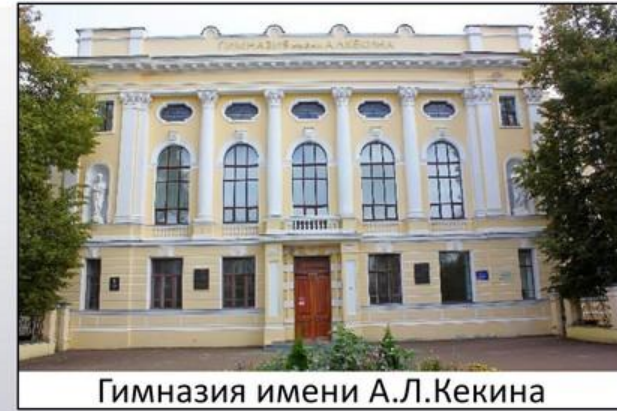
Гимназия имени А.Л.Кекина