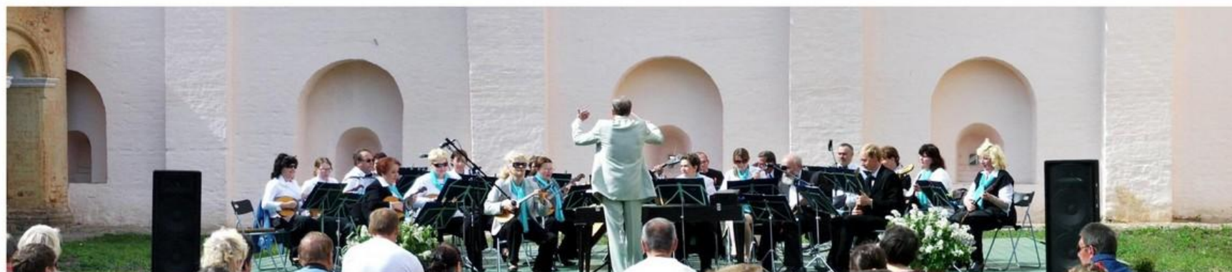
Народный коллектив Оркестр русских народных инструментов им. Сергеева