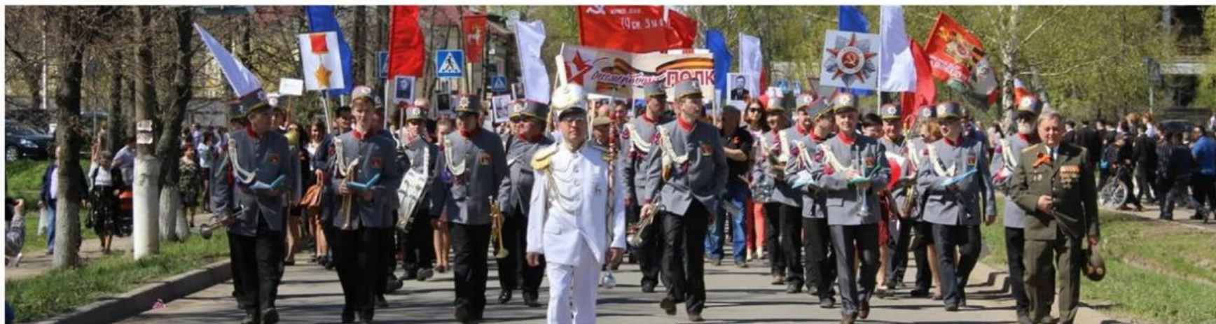
МУ ПХК «Ростовский муниципальный духовой оркестр»

ЖЕМЧУЖИНА ЗОЛОТОГО КОЛЬЦА РОССИИ РОСТОВ ВЕЛИКИЙ 862 - 2015