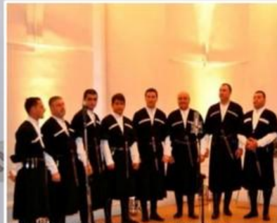
МЕЖДУНАРОДНЫЙ ФЕСТИВАЛЬ СРЕДНЕВЕКОВОЙ МОНАСТЫРСКОЙ КУЛЬТУРЫ «РОСТОВСКОЕ ДЕЙСТВО»