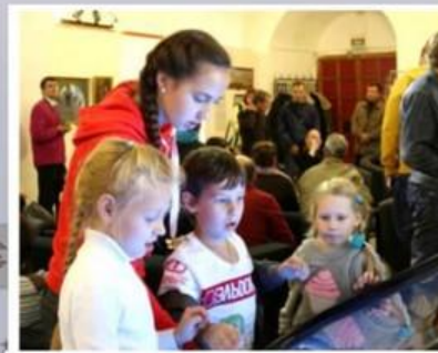
МУЗЕЙНАЯ ГОСТИНАЯ. ИНФОРМАЦИОННЫЙ ЦЕНТР

Государственный музей-заповедник «Ростовский кремль». Расположен на территории Ростовского кремля. Единственный музей федерального подчинения в Ярославской области. Крупный научный центр по изучению археологии, архитектуры, искусства, истории. На территории музея ежегодно проводятся праздники, фестивали и акции: Международная акция «Ночь в музее», фестиваль музыки и ремесел «Живая старина», фестиваль студенческого творчества «Тополиный пух», фестиваль «Ростовская финифть», международный фестиваль средневековой монастырской культуры «Ростовское действо», праздник «Медовый спас».