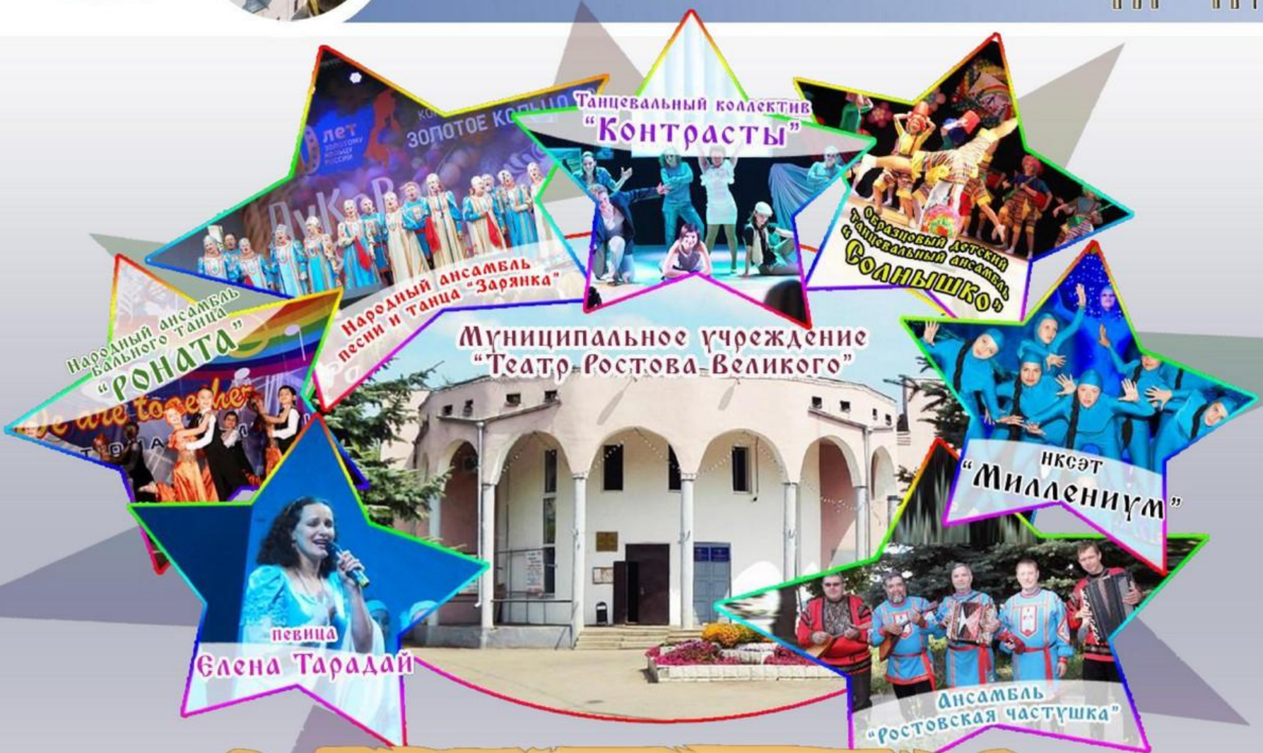
Танцевальный коллектив "Контрасты"