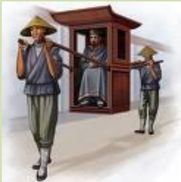
Чиновник в паланкине