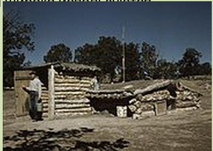
Землянки - первые жилища простых китайцев