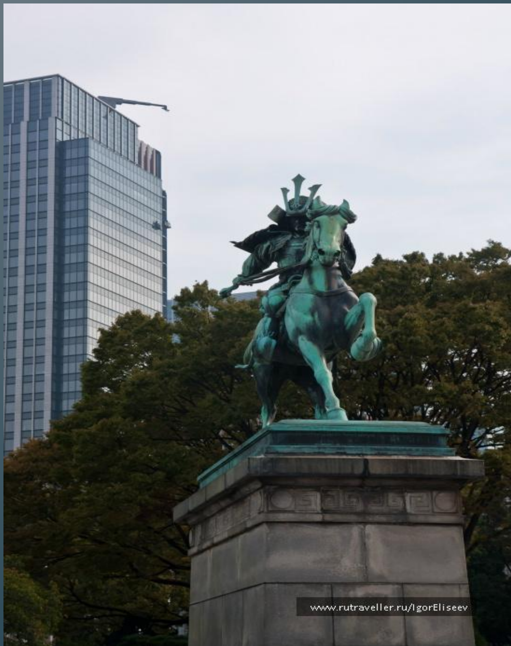
Конная статуя Кусуноки Масасигэ.