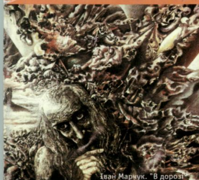
Художник Іван Марчук Іван Марчук. "В дорозі"