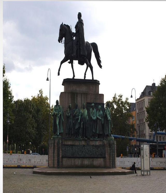
Памятник Фридриху Вильгельму III