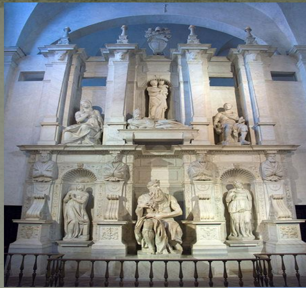
Гробниця па́пи Ю́лія II