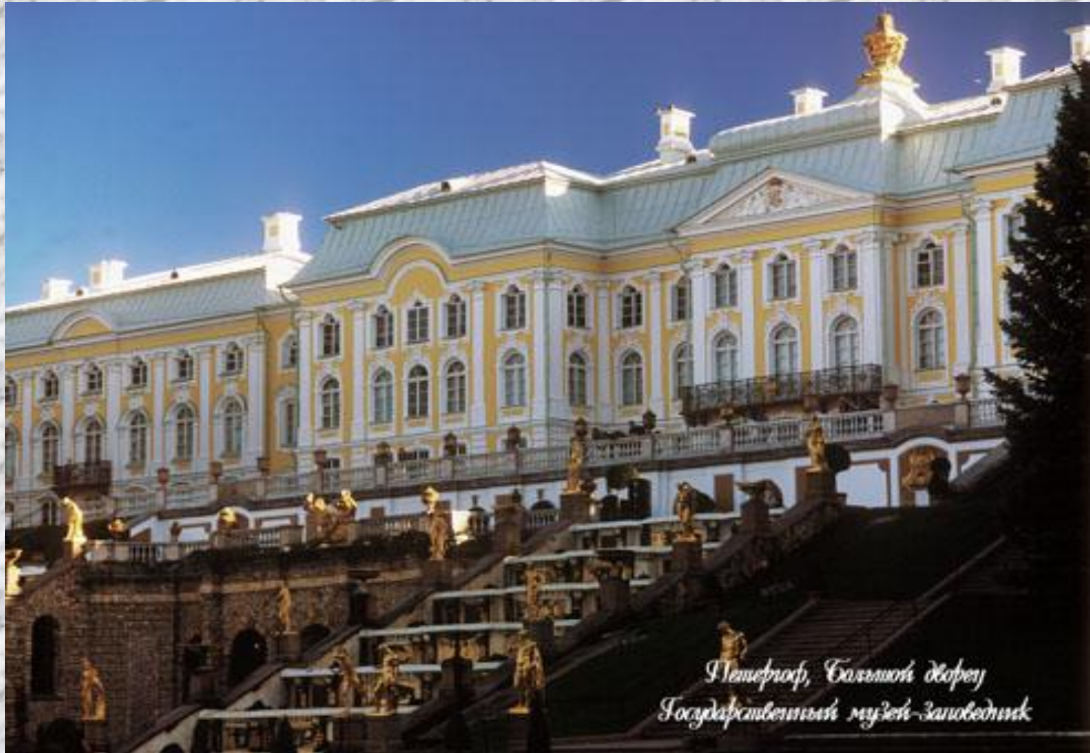
Петергоф, Большой дворец Государственный музей-заповедник