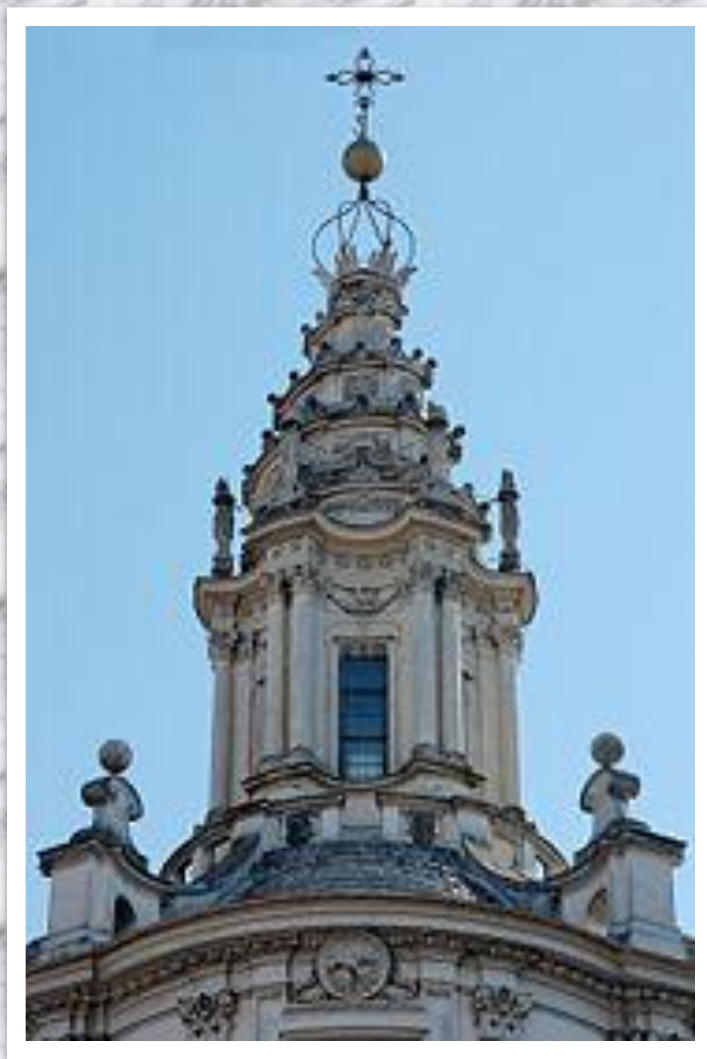
Навершие университетской Церкви в Риме.