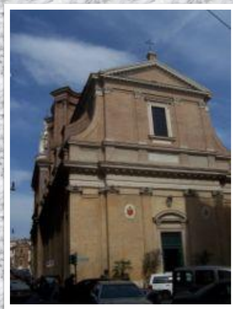
Фасад Сант- Андреа- делле-Фратте