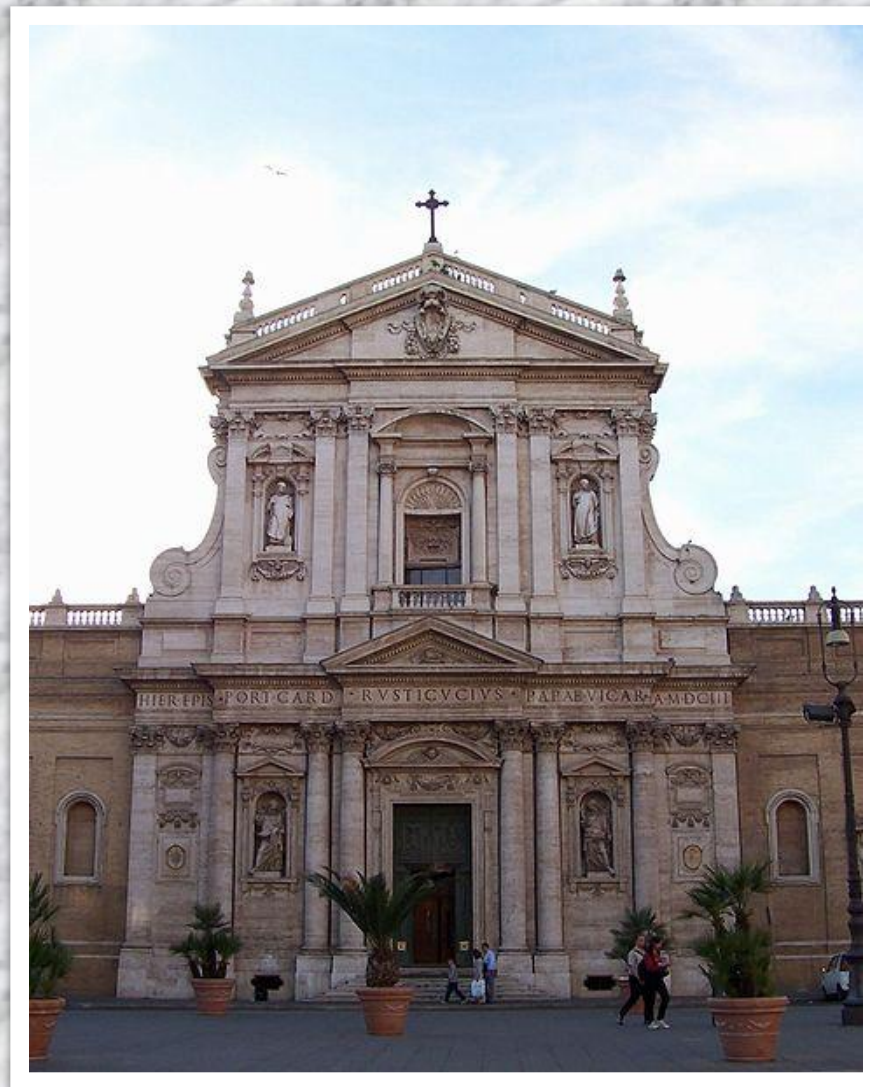
Карло Мадерна Церковь Святой Сусанны