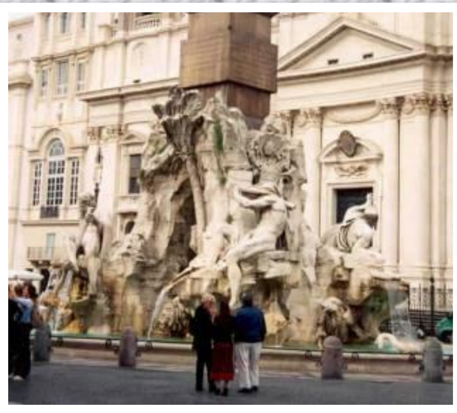
Фонтан четырёх рек.