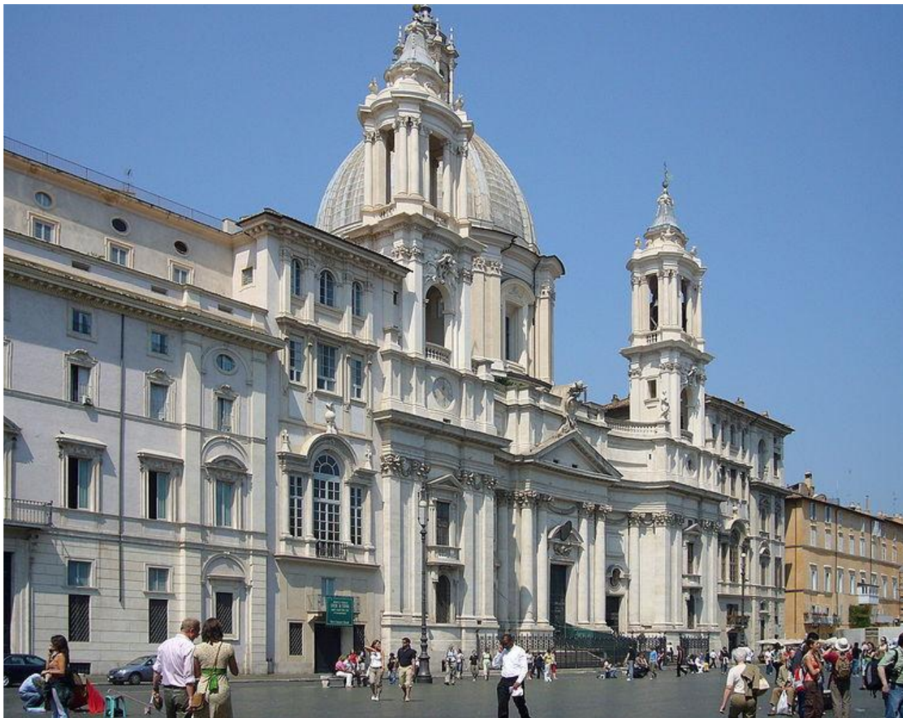
Франческо Борромини Церковь Сант Анъезе в Риме