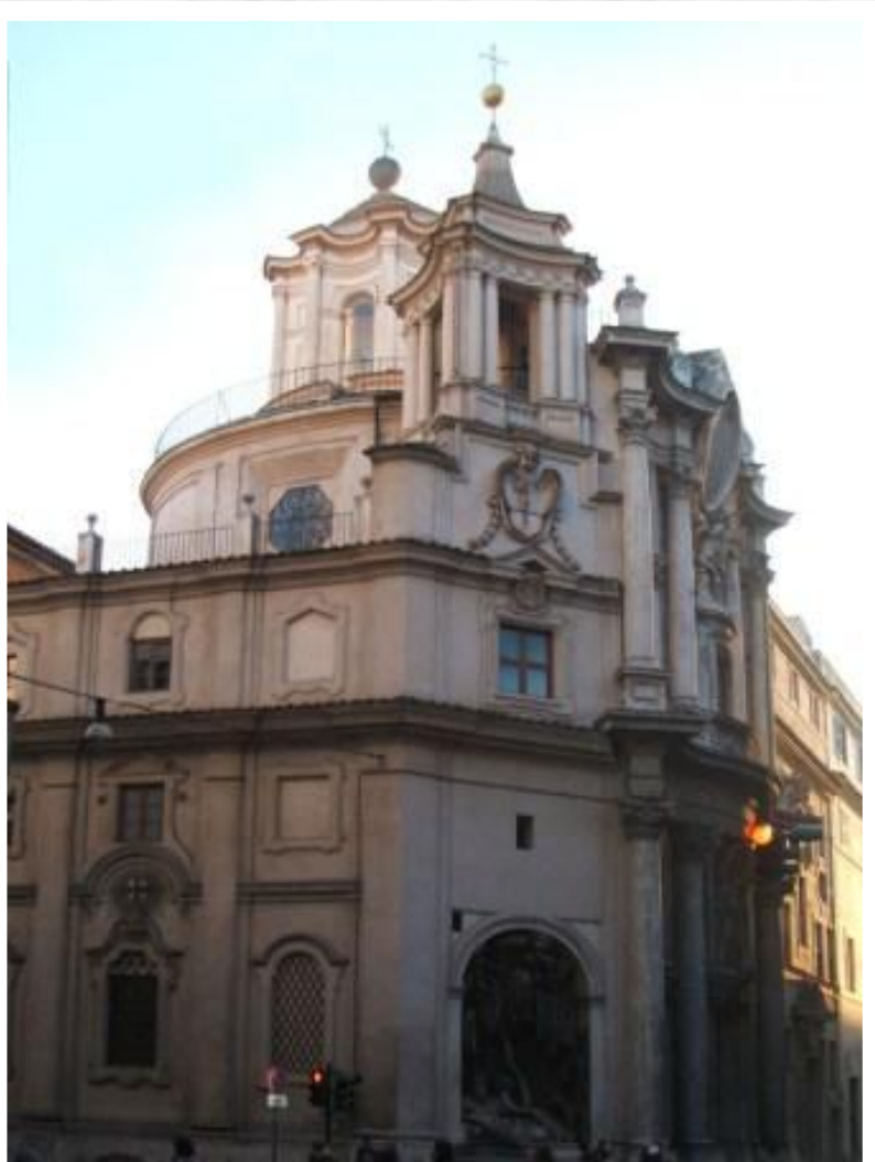
Франческо Борромини Сан-Карло-алле-Куаттро- Фонтане