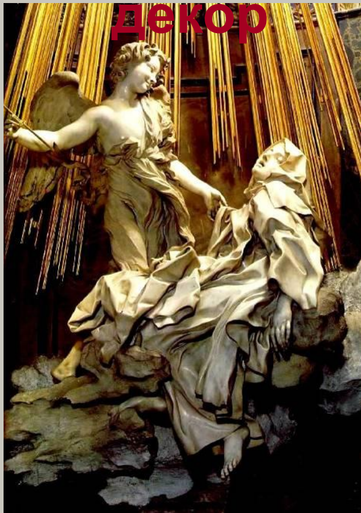
Экстаз святой Терезы.