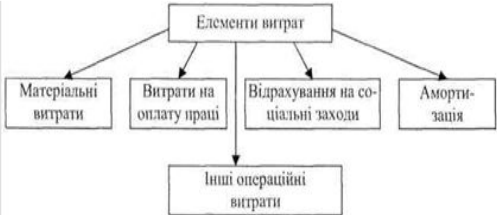
Рис. 10.2. Структура витрат за економічно однорідними елементами