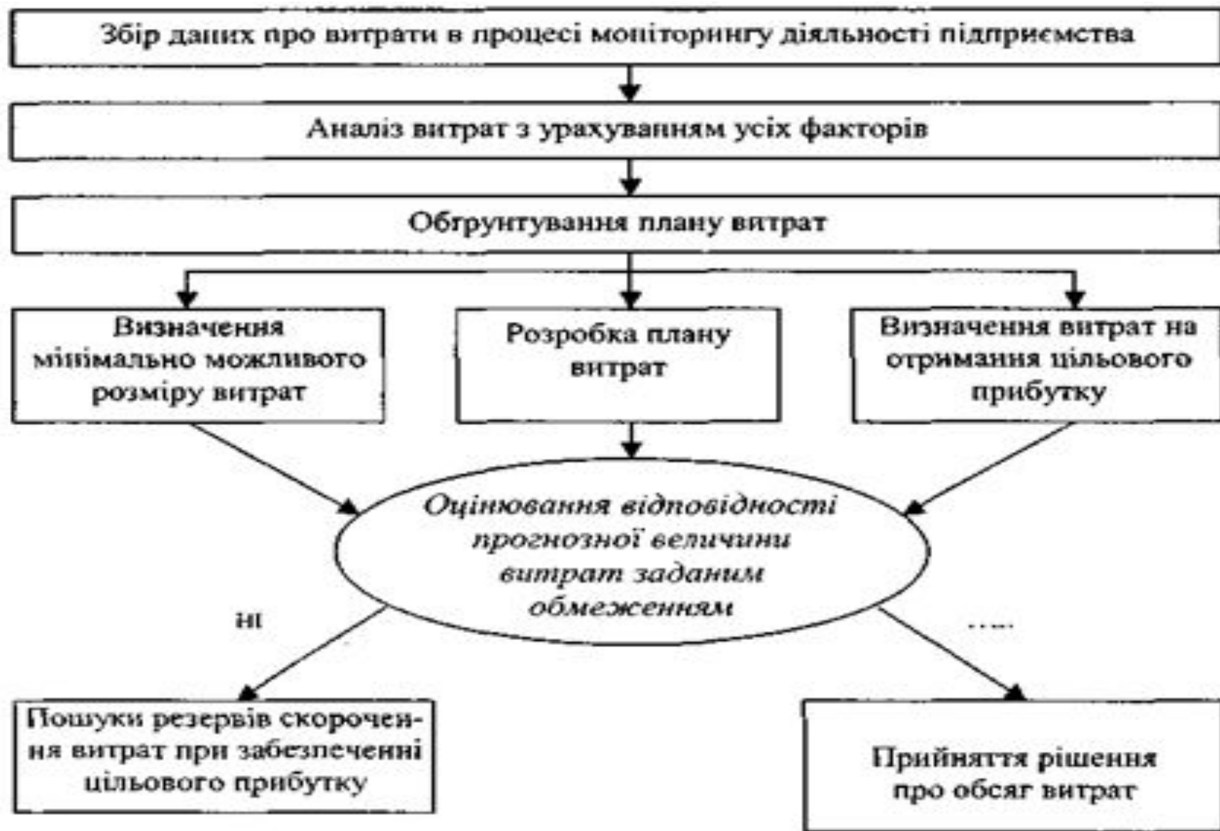
Рис. 10.3. Алгоритм планування витрат туристичного підприємства