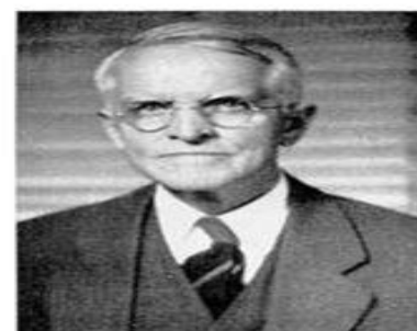
МИТЧЕЛЛ Уэсли Клэр (1874-1948)

Институционально- статистическое направление