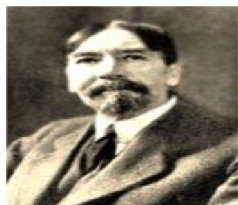
ВЕБЛЕН Торстейн Бунде (1857–1929)