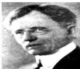
КОММОНС Джон Роджерс (1862–1945)