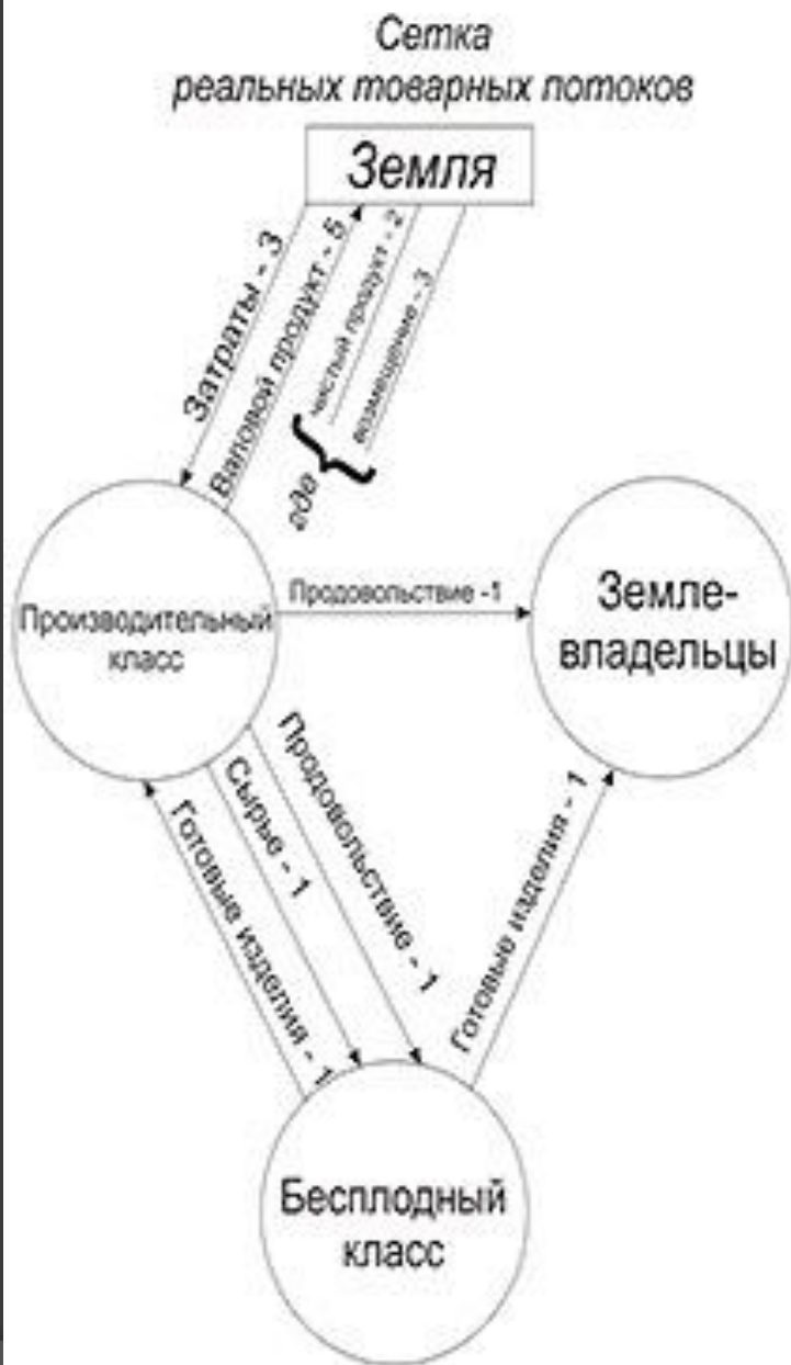
Схема товарного и денежного обращения в "Экономической таблице" Ф. Кенэ 1766 г.