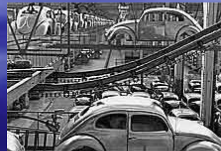
автозавод в Вольфсбурге