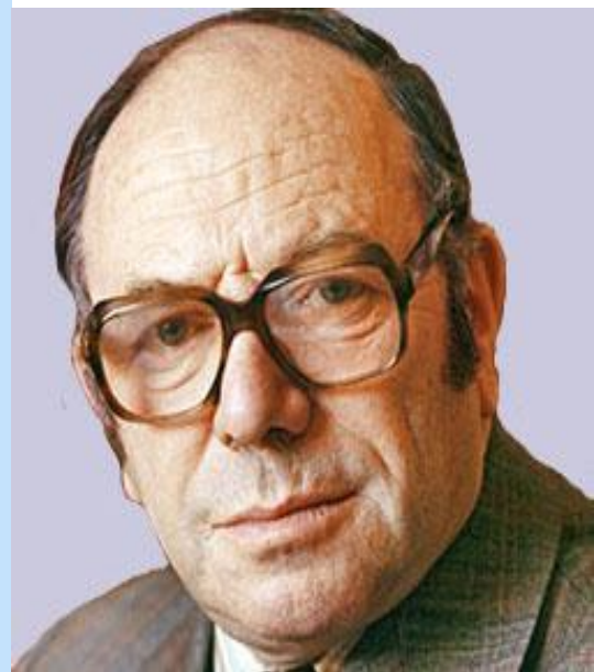
Леонид Витальевич Канторович

Вопросы экономического стимулирования рационального использования трудовых ресурсов остаются актуальными и сейчас.