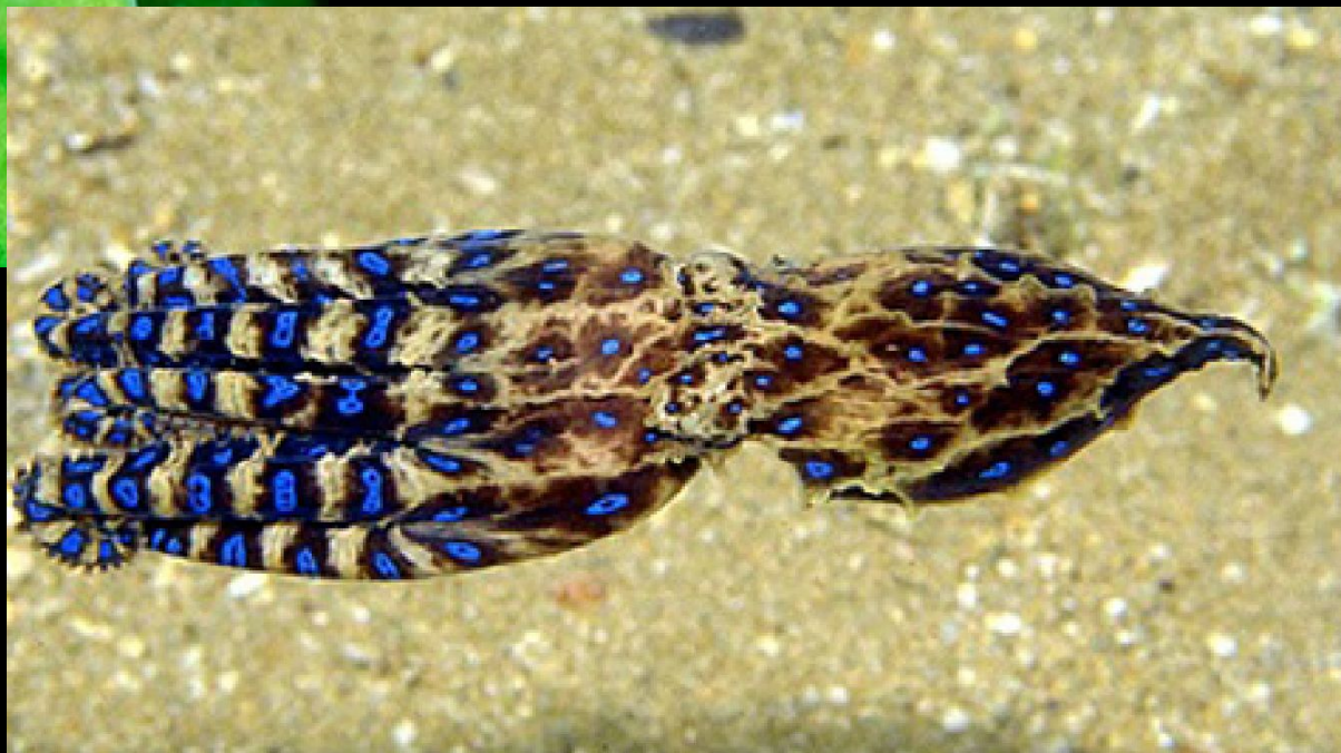
5. Древолазы или Ядовитые лягушки