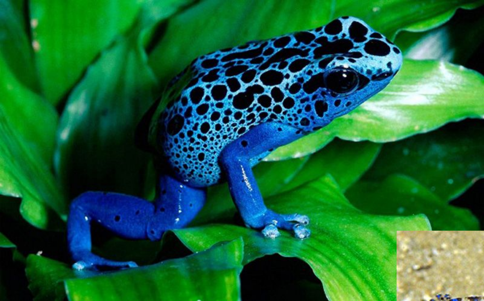
6. Синий кольцевидный Осьминог