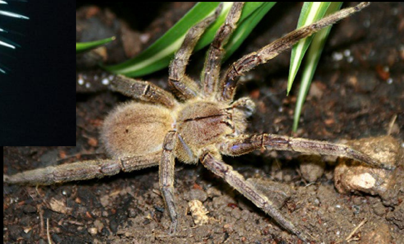
7. Бразильский Блуждающий Паук