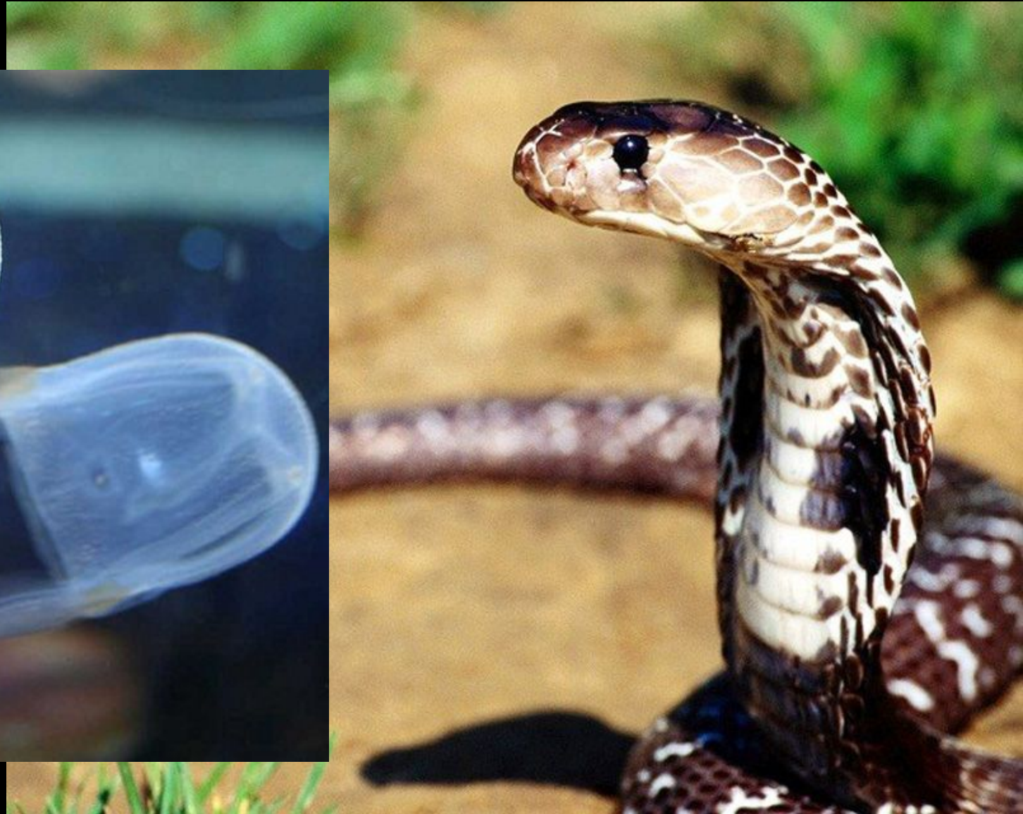
2. Королевская кобра