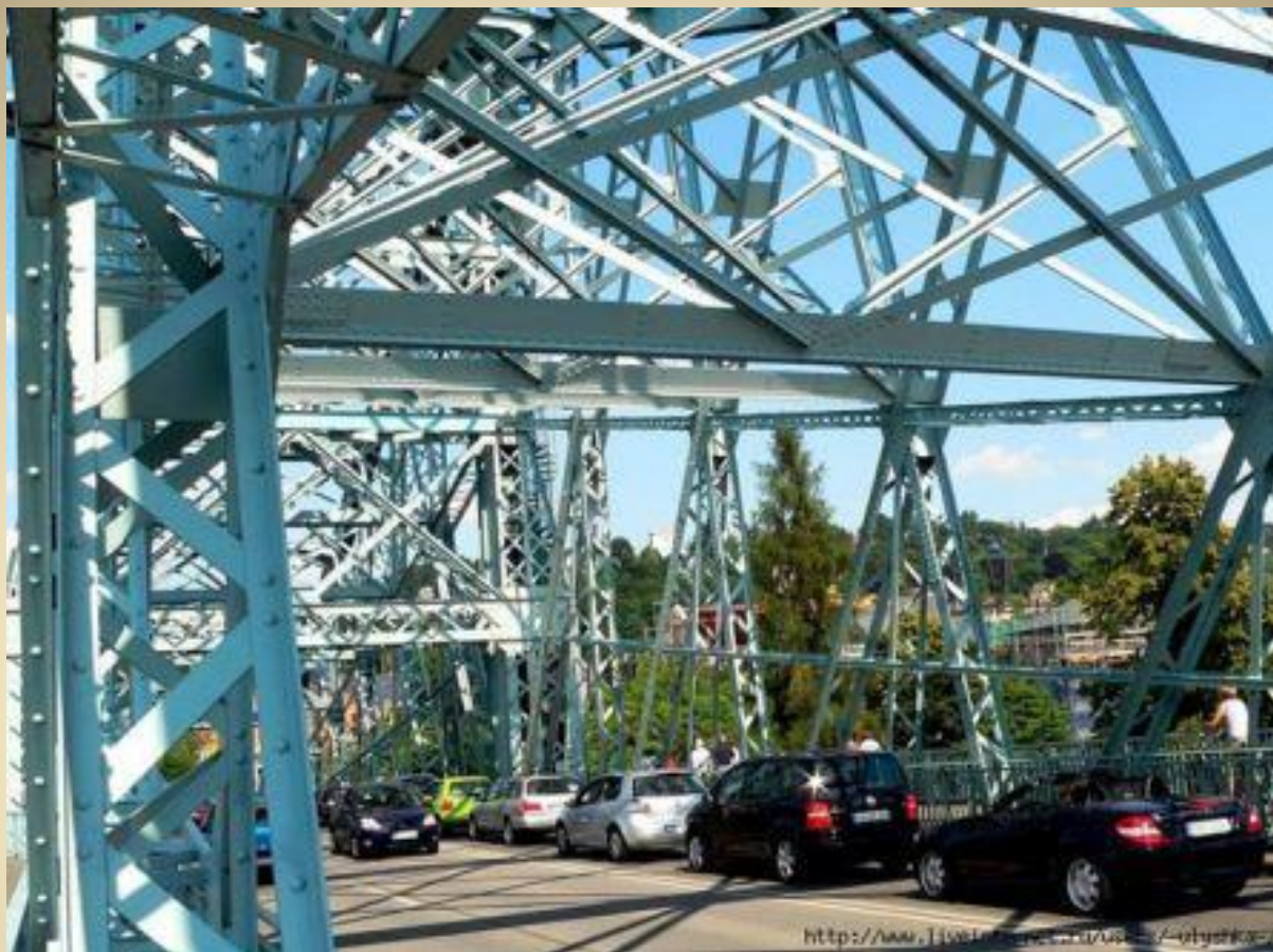
Продукция металлургической промышленности Лошвицкий мост, Дрезден