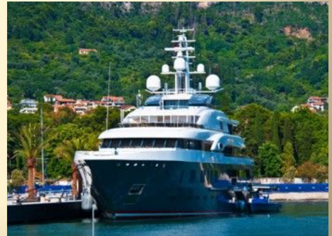
Судостроительная компания: Lu"rsen