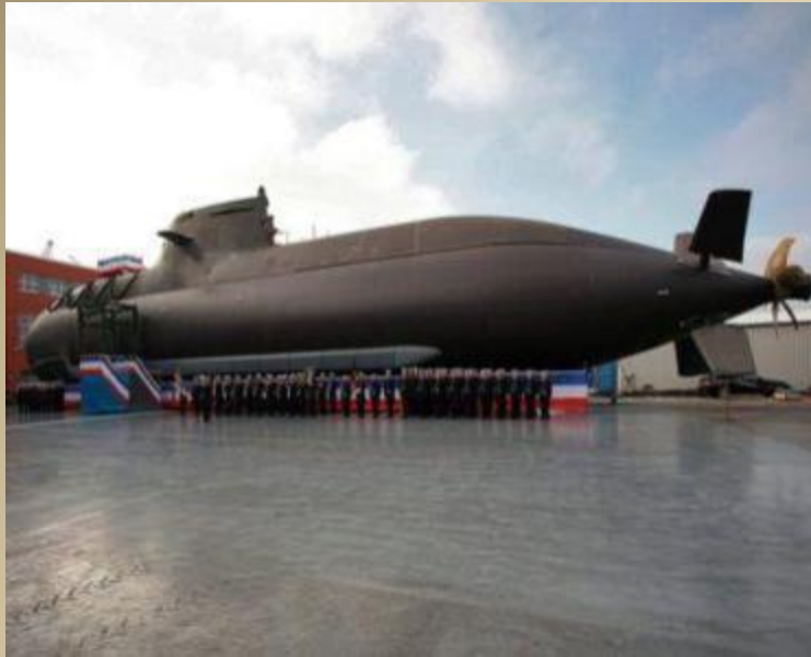
Продукция верфи в Киле