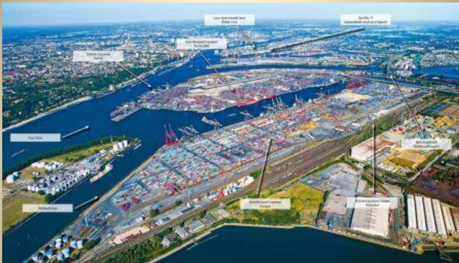
Порт Гамбург - крупнейший в Германии