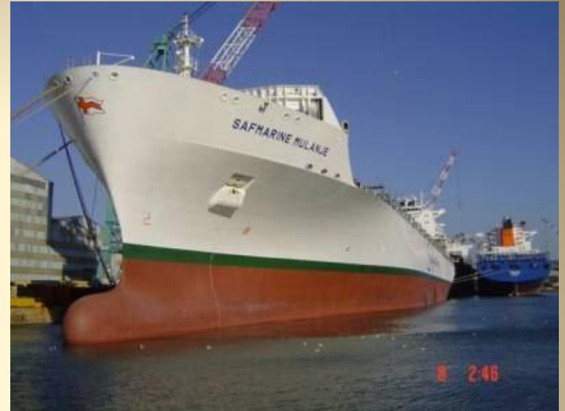
Продукция верфи в Ростове