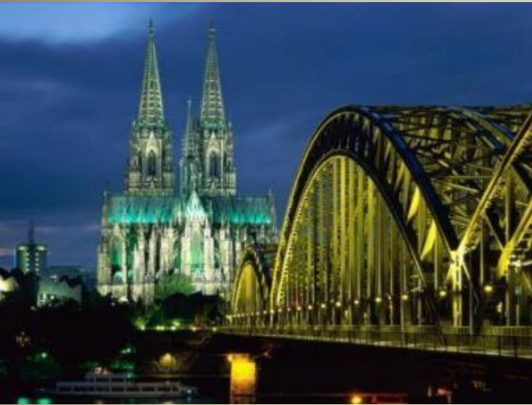
Боннский кафедральный собор