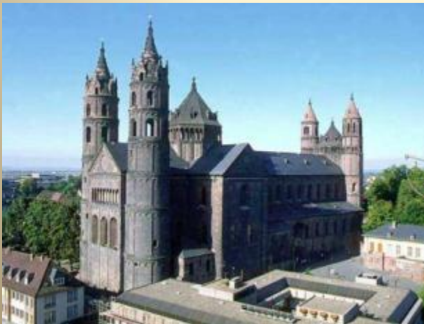
Собор в Вормсе