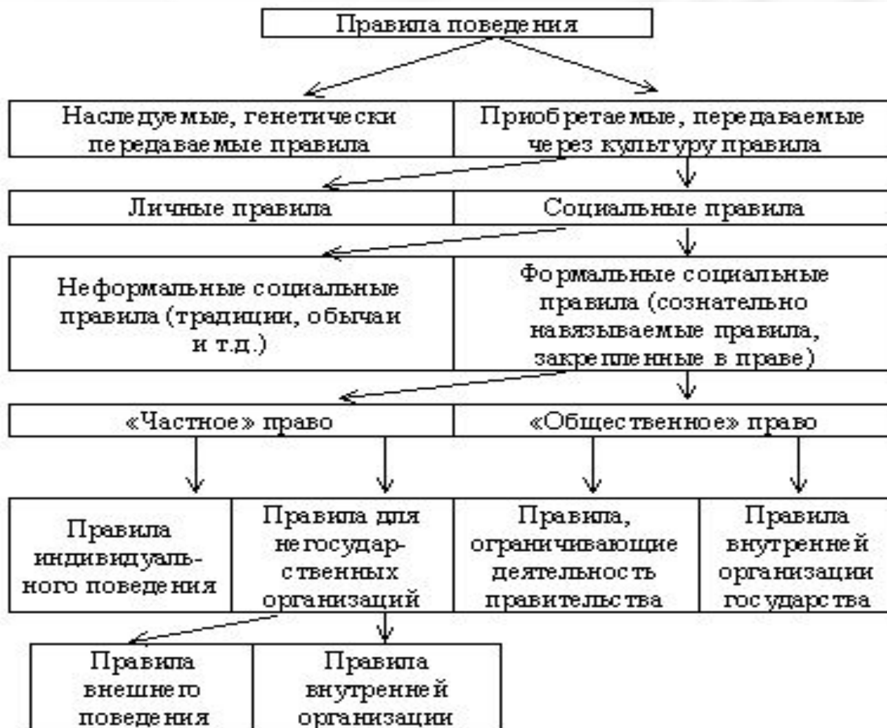
Классификация видов правил (по В. Ванбергу)