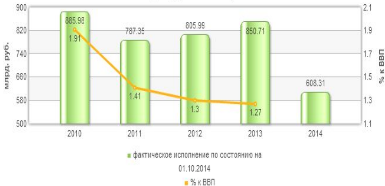
Динамика расходов федерального бюджета Общегосударственные вопросы