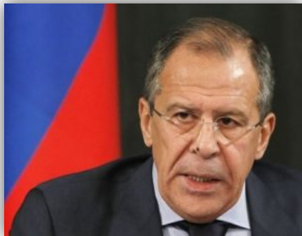
постоянный представитель России при ООН - Сергей Лавров

Организация Объединённых Наций была создана 24 октября 1945 года. Союз Советских Социалистических Республик был одной из стран-основателей организации и ее членом с момента учреждения ООН.