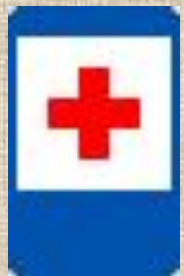
"Пункт первой медицинской помощи"