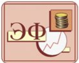
Таблица основных технико-экономических показателей