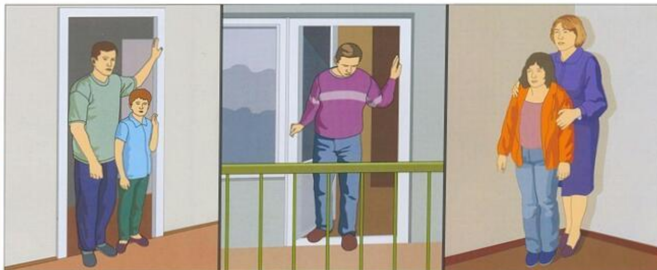
На втором и последующих этажах встаньте в проём входной или балконной двери, отойдите от окон и займите место в углу, образованном капитальными стенами