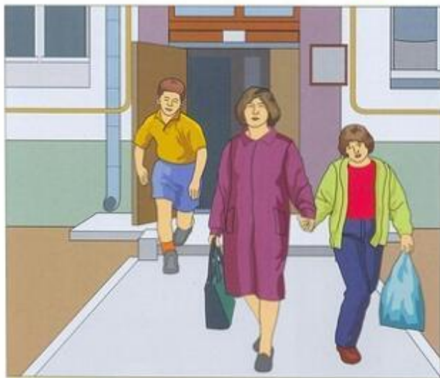
Быстро покиньте здание (в вашем распоряжении 15—20 секунд)