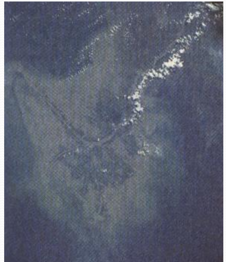
Вид из космоса