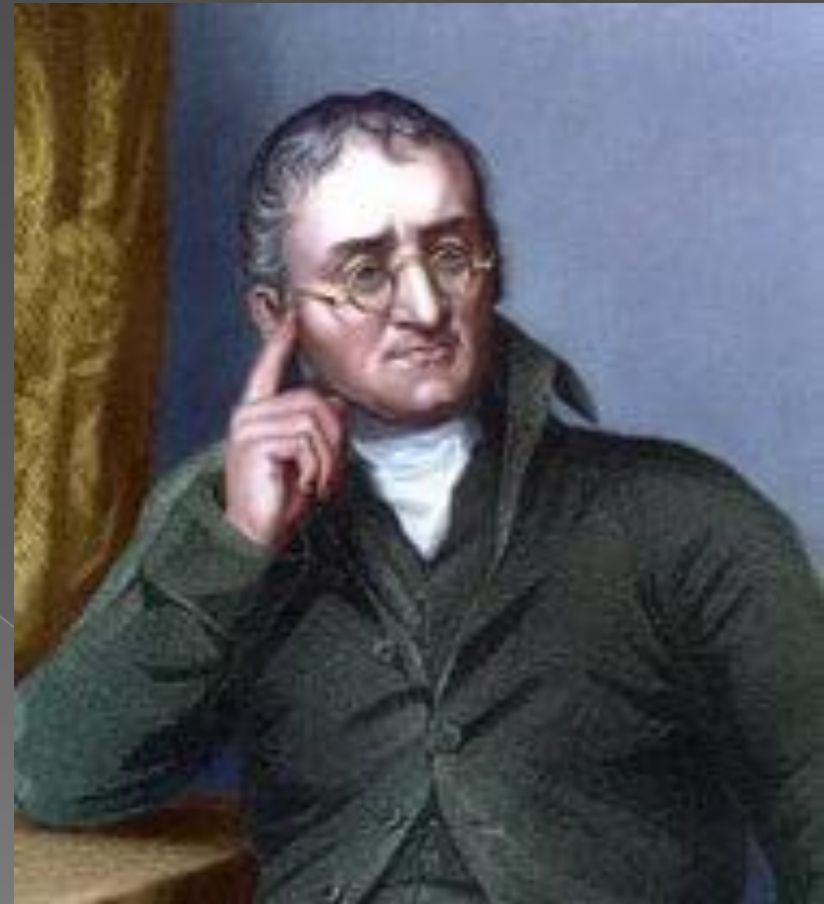
Джон Дальтон (1766-1844)