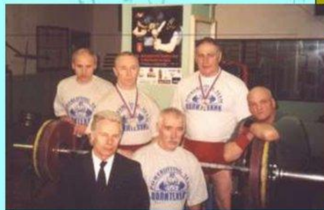
Команда ветеранов по атлетизму

Снижение интеллекта, психическая и физическая истощенность, болезни, укорочение жизни