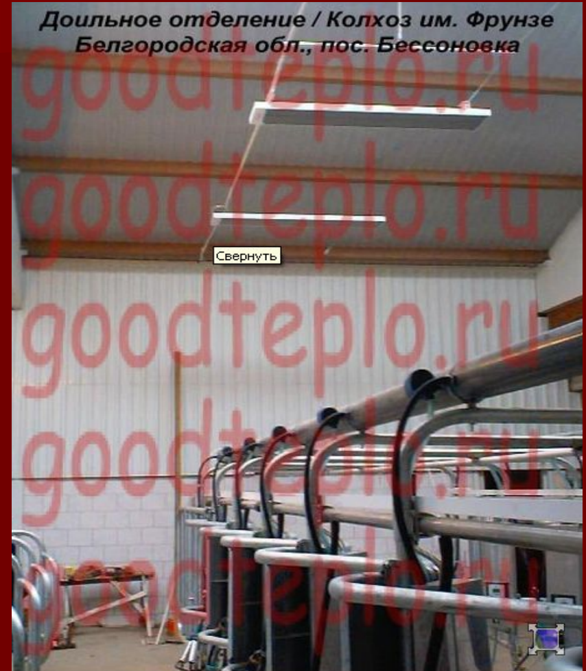
Отопление коровника инфракрасными обогревателями