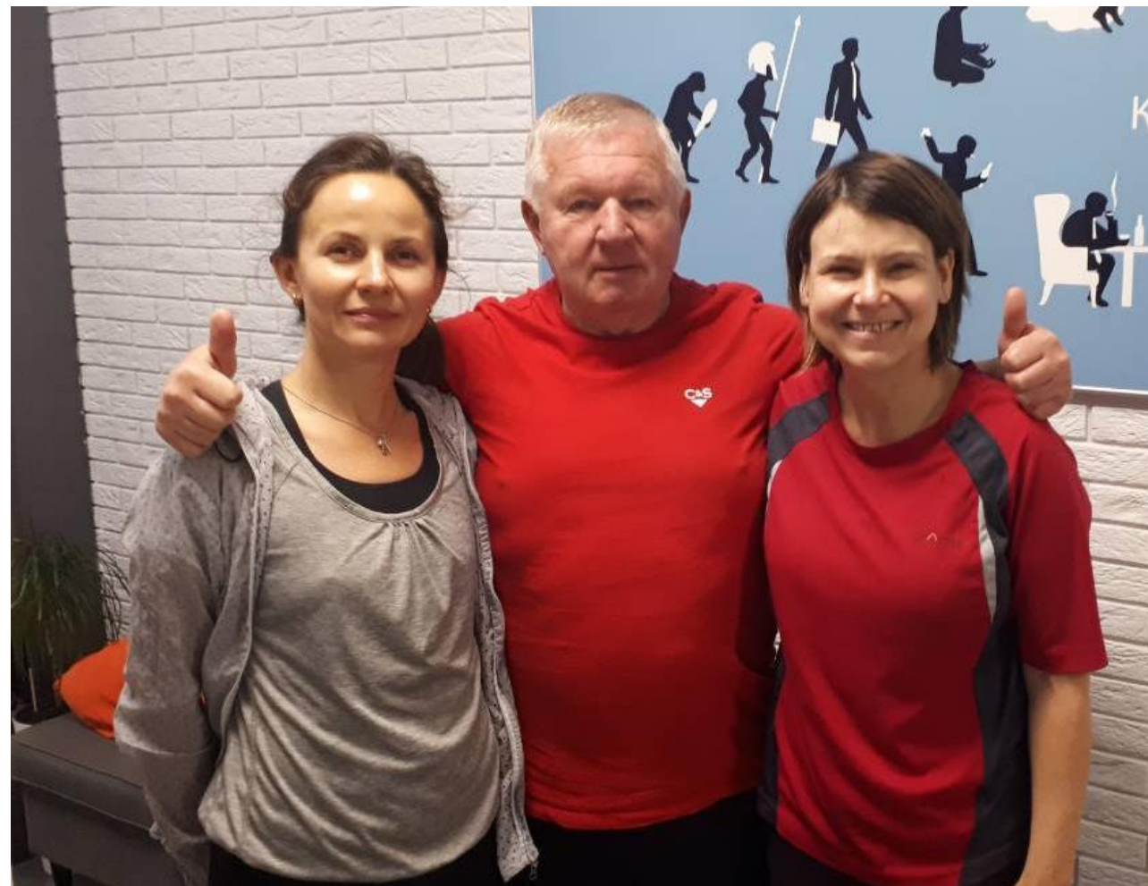
2018, ПОСОЛ ВЕЛИКОБРИТАНИИ В РБ ФИОННА ГИББ