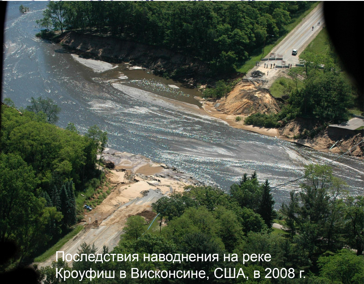
Последствия наводнения на реке Кроуфиш в Висконсине, США, в 2008 г.