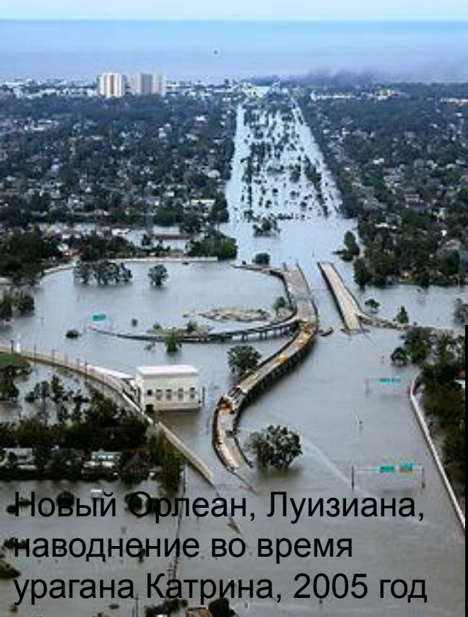
Новый Орлеан, Луизиана, наводнение во время урагана Катрина, 2005 год